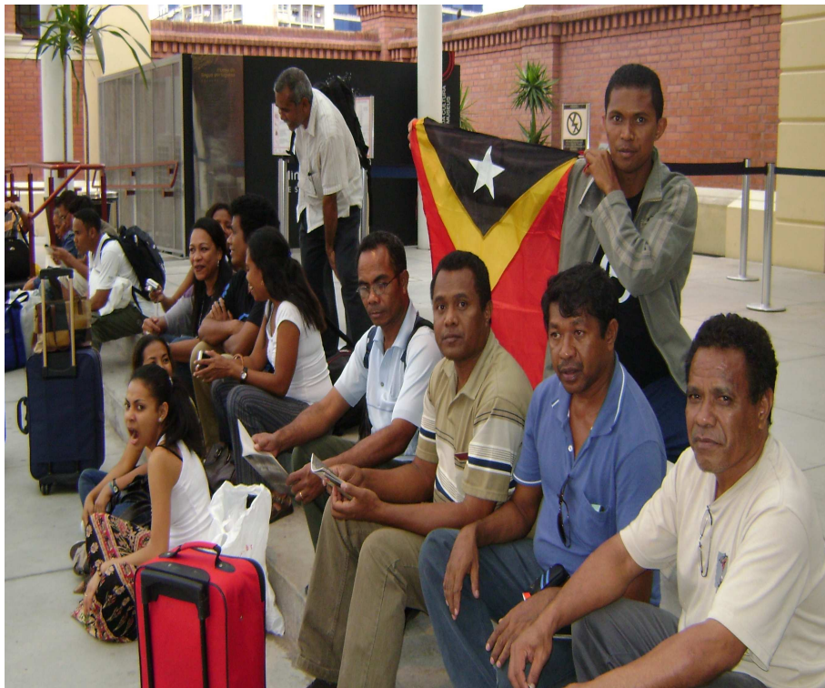
Figura 2: No primeiro dia da nossa chegada a São Paulo dia 11 de dezembro de 2008