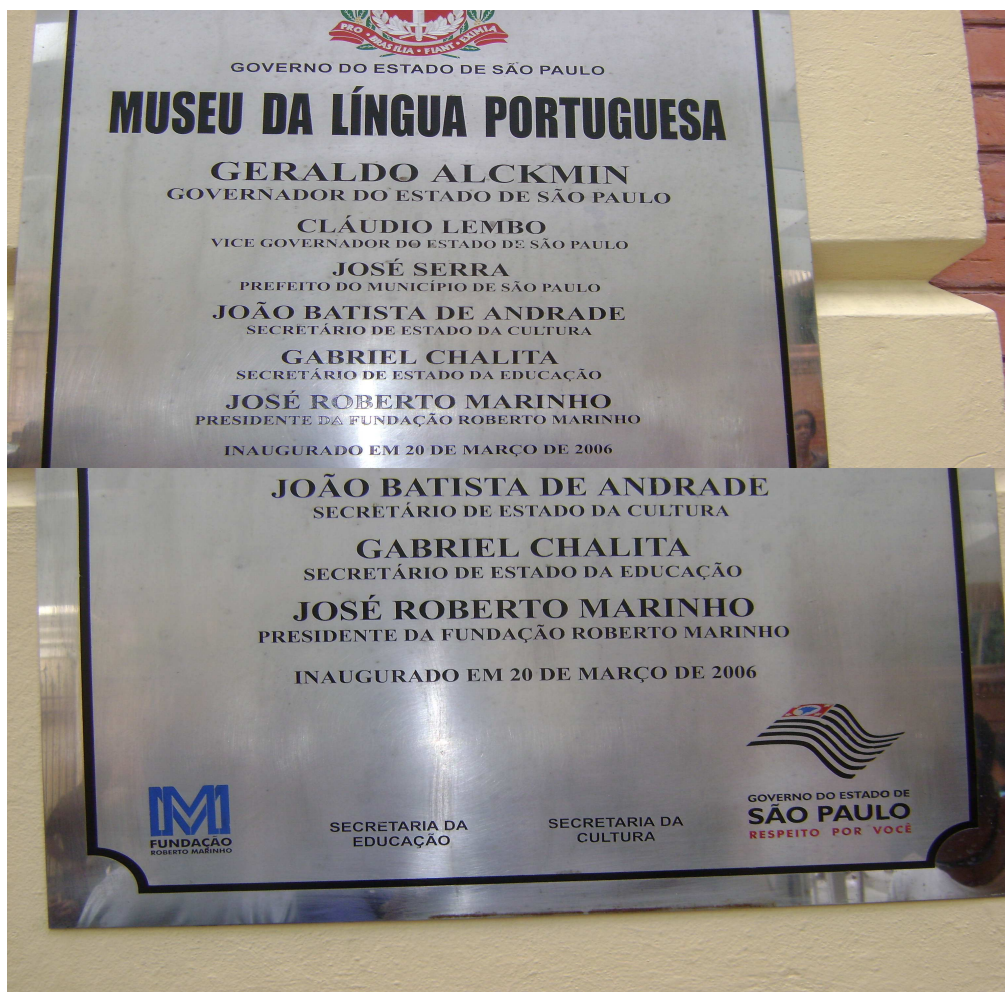
Figura 3: Museu da Língua Portuguesa do Estado de São Paulo dia 12 de dezembro de 2008.