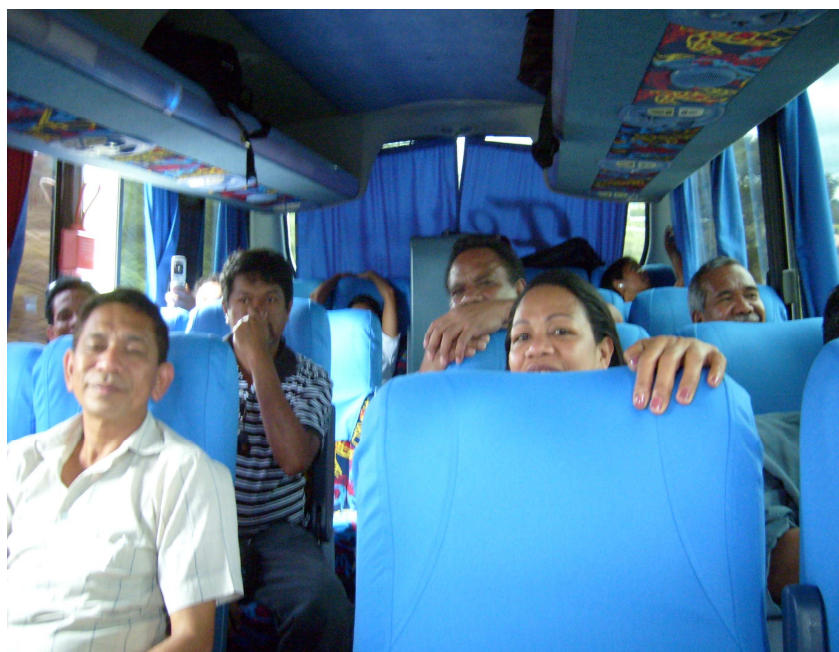
Figura 14: A nossa viagem de São Paulo para o Município de Santo André. dia 12 de dezembro de 2008.