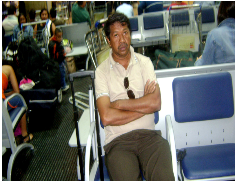
Figura 23: No Aeroporto Internacional Guarulhos, São Paulo O retorno a Fortaleza-Ceará. São Paulo, 15 de Dezembro de 2008.