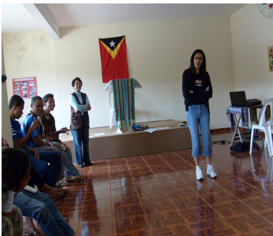
Figura 5: Abertura do I encontro dos estudantes timorenses no Brasil. Primeira apresentação com o tema “Brasil e Timor-Leste, “Dois países, duas culturas e aspectos de uma história comum” Santo Andre, 13 de dezembro de 2008.