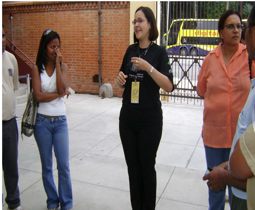
Figura 4: Ouvimos a explicação da Diretora do Museu da língua Portuguesa do Estado de São Paulo sobre a história do Museu.