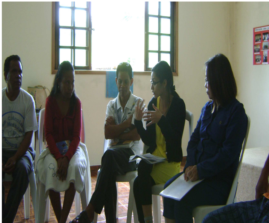
Figura 6: Discussão São Paulo, 13 de dezembro de 2008.