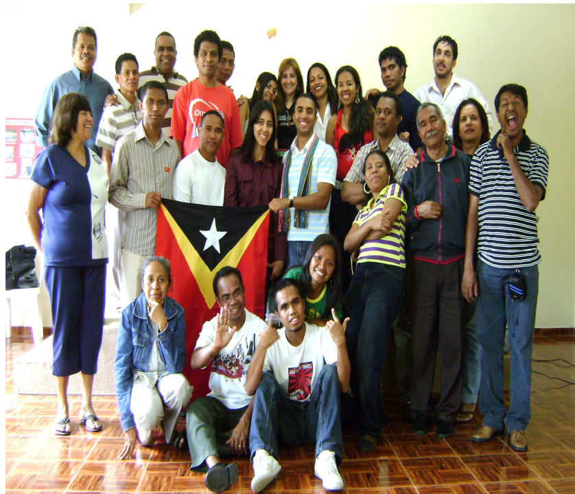
Figura 19: Pose juntos com os participantes do após encerramento do Do I encontro dos estudantes timorenses no Brasil. Santo Andre, 14 de dezembro de 2008