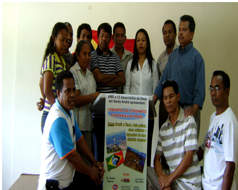
Figura 22: 12 estudantes timorenses do curso de Pós-Graduação em Universidades Federais no Brasil São Paulo, 15 de Dezembro de 2008.