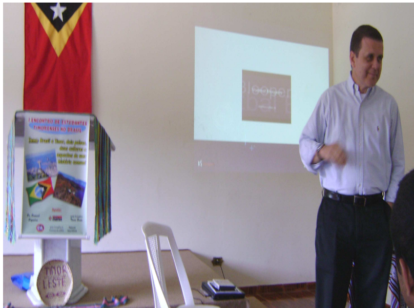
Figura 13: Apresentação de um dos membros da ONG AME “Comunicação Social do Brasil e o Mundo” São Paulo, 13 de dezembro de 2008.