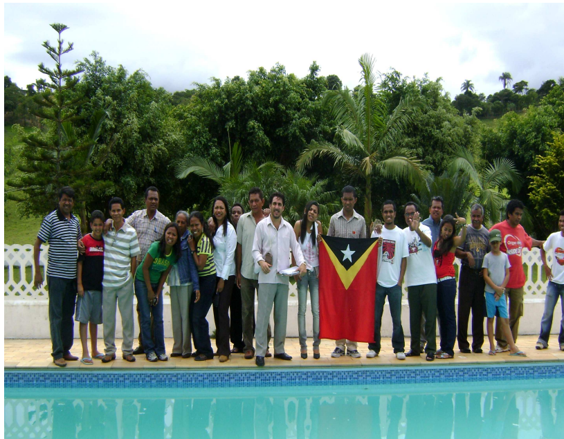
Figura 20: A última pose antes da nossa partida do Município de Santo André para São Paulo. Santo André, 14 de dezembro de 2008.