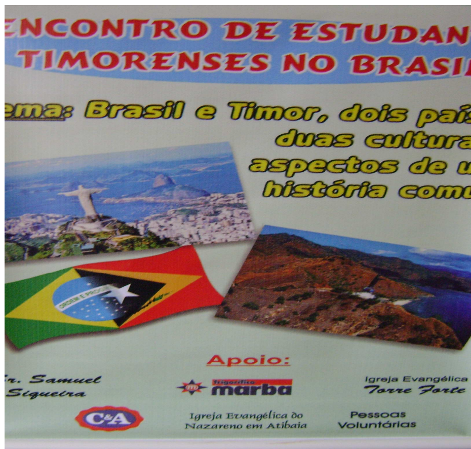
Figura 1: O tema do I encontro dos estudantes timorenses no Brasil. São Paulo 11 – 14 de dezembro de 2008