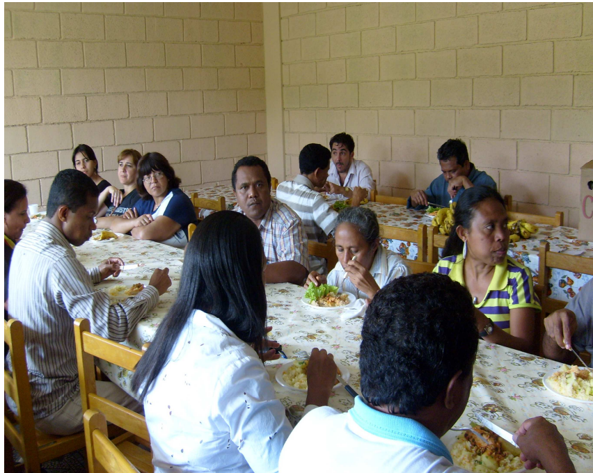
Figura 15: Bom apetite, combinações de duas comidas e duas culturas, Brasil e Timor-Leste. Santo Andre, 13 de dezembro de 2008.