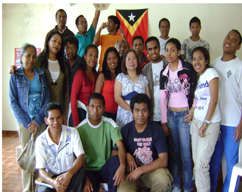
Figura 21: Pose juntos depois as nossas despedidas no São Paulo Santo Andre, 15 de Dezembro de 2008.