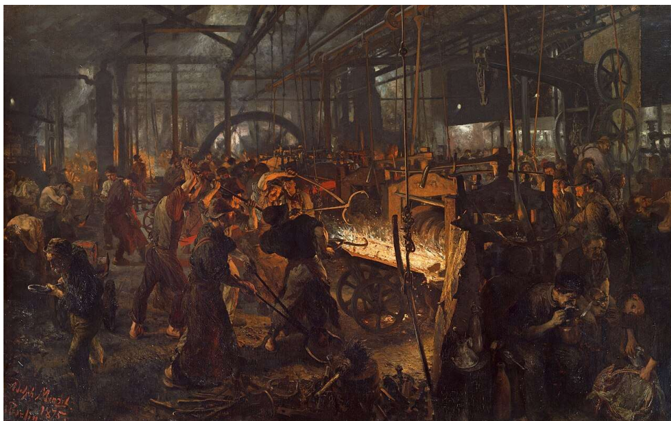
Fonte: MENZEL, Adolph von. The Iron Rolling Mill (Modern Cyclopes) . 1875. Óleo sobre tela, 158 x 254 cm. Alte Nationalgalerie, Berlim. Legenda: Representação das condições extenuantes (e coletivas) do trabalho fabril na segunda metade do século XIX, contexto histórico que possibilitou o surgimento da greve como forma de resistência vinculada ao trabalho assalariado e à formação da classe operária.

Conforme observa Danilo Uler, nos regimes escravistas e feudais, as condições materiais e políticas tornavam inviável qualquer forma de paralisação coletiva semelhante à greve. Em primeiro lugar, como afirmado anteriormente, as formas de trabalho predominantes, o trabalho escravizado, servil ou familiar, não pressupunham a venda da força de trabalho nem a liberdade formal do trabalhador. Em segundo lugar, os trabalhadores estavam dispersos em pequenas unidades produtivas, isoladas entre si, o que dificultava enormemente a articulação coletiva. Além disso, os produtores diretos não eram reconhecidos como sujeitos de direito: estavam juridicamente subordinados a seus senhores e formalmente excluídos dos aparelhos do Estado, cujos cargos e prerrogativas eram monopólio da classe dominante. Nessas condições, a reivindicação coletiva não podia assumir a forma de negociação e, portanto, tampouco a de greve. O que se via eram atos de resistência difusos, rebeliões localizadas ou explosões de violência, rapidamente reprimidas. Faltavam, em suma, elementos estruturais que apenas o capitalismo viria a reunir 24 .