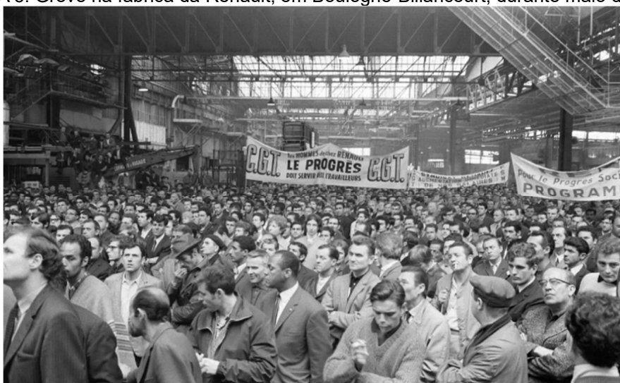
FIGURA 3: Greve na fábrica da Renault, em Boulogne-Billancourt, durante maio de 1968.

Além disso, a própria geografia do fordismo, caracterizada pela concentração industrial, grandes cidades operárias e complexos fabris, favorecia a rápida e ampla mobilização grevista. Nesses contextos, greves de grande escala nem sempre podiam ser domesticadas pela estrutura juslaboral e sindical, como ilustra o caso da greve geral francesa de maio de 1968, que paralisou, entre outras, a fábrica da Renault em Boulogne-Billancourt.