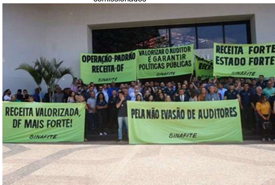
Figura 9 – Auditores da Receita do DF anunciam operação-padrão e entrega de cargos comissionados

Esses modelos de greve, apesar de pouco discutidos em âmbito jurídico, são reconhecidos no cenário sindical. Um exemplo mais recente ocorreu em setembro de 2023, quando os auditores fiscais da Receita do Distrito Federal deflagraram uma operação-padrão acompanhada da entrega coletiva de 130 cargos comissionados vinculados à Subsecretaria de Receita da Secretaria de Fazenda do DF 134 .