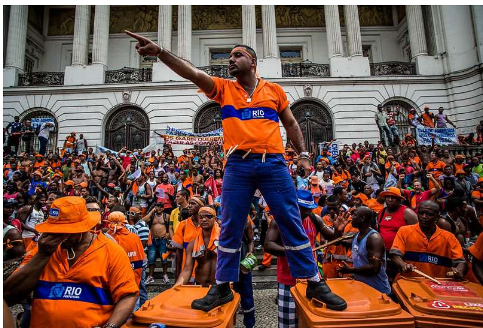
Figura 15- Greve dos garis no Rio de Janeiro, em 2014.

Fonte: MÍDIA NINJA. Greve dos garis, no Rio de Janeiro, surpreende ao paralisar o serviço de limpeza urbana em pleno carnaval: 37% de reajuste salarial e uma nova utopia para resistência fora