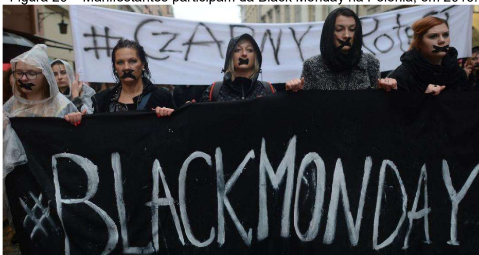
Figura 20 – Manifestantes participam da Black Monday na Polônia, em 2016.

As trabalhadoras passaram a usar essa força recém-conquistada no mercado formal para reivindicar direitos, resistir a ataques legislativos e denunciar desigualdades históricas. O pontapé inicial desse movimento moderno pode ser identificado na Polônia, em 2016, quando milhares de mulheres paralisaram o trabalho e protestaram no chamado “Black Monday” contra a tentativa de proibição quase total do aborto 306 . Logo em seguida, no mesmo ano, a Argentina protagonizou o “Miércoles Negro”, com paralisações e manifestações massivas contra a onda de feminicídios do país 307 .