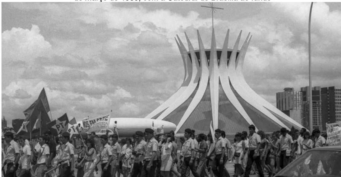
Figura 6 – Manifestação de grevistas na Esplanada dos Ministérios, durante a greve geral de 14 e 15 de março de 1989, com a Catedral de Brasília ao fundo