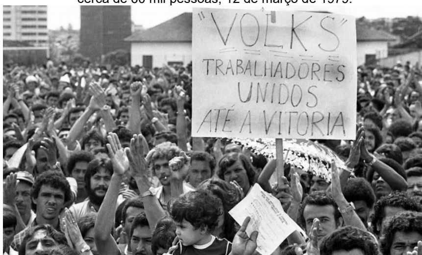
Figura 5: Assembleia dos trabalhadores da Volkswagen que deflagrou a greve do ABC, reunindo cerca de 60 mil pessoas, 12 de março de 1979.

MEMORIAL DA DEMOCRACIA. A grande greve dos trabalhadores do ABC. Disponível em: https://memorialdademocracia.com.br/card/a-grande-greve-dos-trabalhadores-do-abc . Acesso em: 8 ago. 2025.