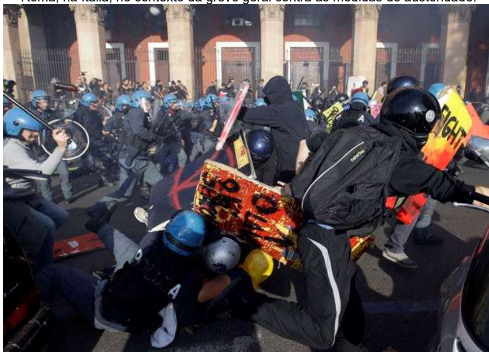
Figura 18 – Manifestantes enfrentam a polícia durante ato realizado em 14 de novembro de 2012, em Roma, na Itália, no contexto da greve geral contra as medidas de austeridade.