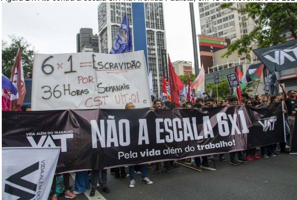
Figura 21: Ato contra a escala 6x1 na Avenida Paulista, em 15 de novembro de 2024.