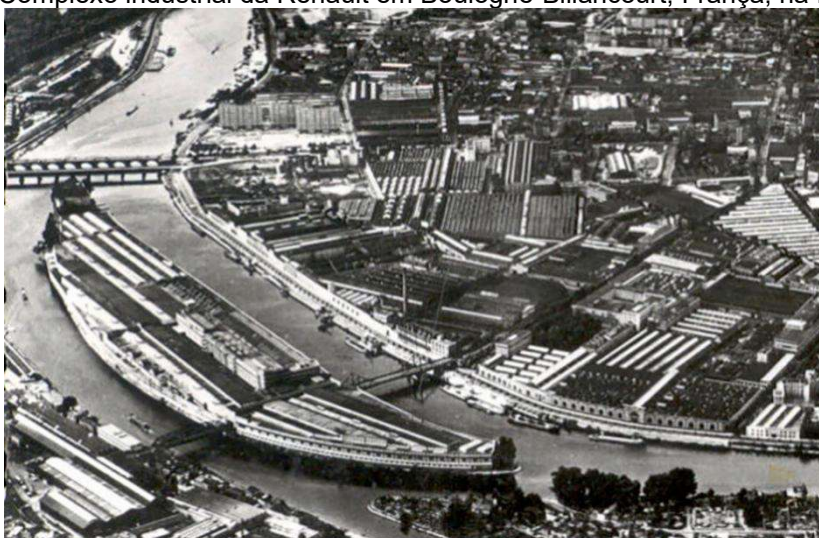
Figura 2 - Complexo industrial da Renault em Boulogne-Billancourt, França, na Ilha Seguin.

Legenda: esse complexo o auge do fordismo francês, marcado pela elevada concentração industrial.