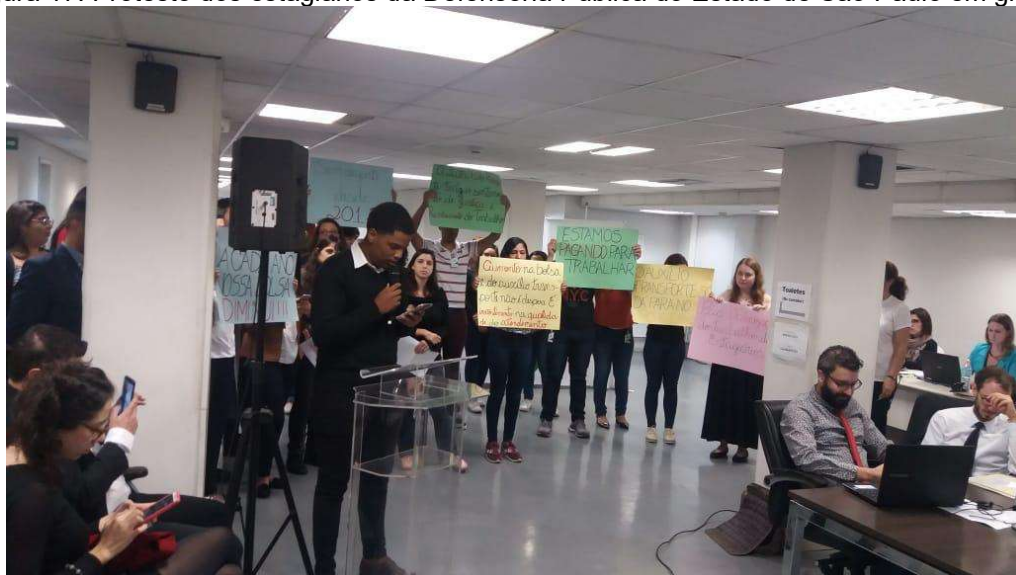
Figura 17: Protesto dos estagiários da Defensoria Pública do Estado de São Paulo em greve.