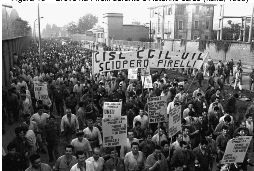
Figura 16 – Greve na Pirelli durante o Autunno caldo (Itália, 1969)

Esse cenário de crise começava também a transbordar para as ruas. As grandes greves e protestos operários, do Maio de 1968 na França às mobilizações em Detroit, nos EUA, e Turim, na Itália, escancararam a possibilidade de ruptura: a classe trabalhadora mostrava-se capaz de desafiar os limites da domesticação fordista, e as elites passaram a encarar o ativismo operário e as conquistas sociais como obstáculos à lucratividade e à ordem vigente 194 .