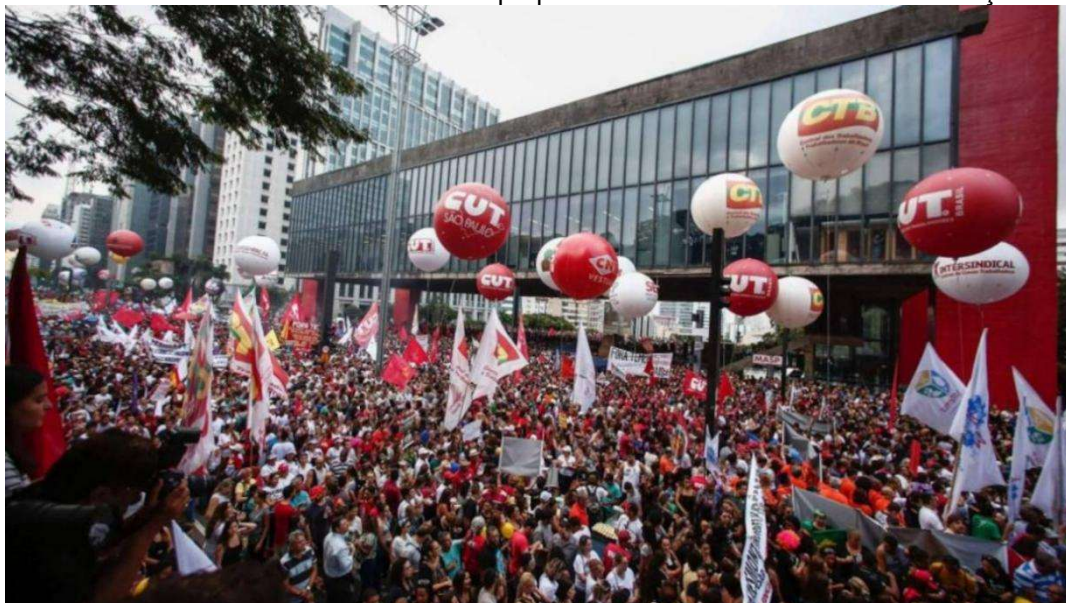
Figura 12 – Ato na Avenida Paulista contra a proposta de reforma da Previdência. Março de 2017.