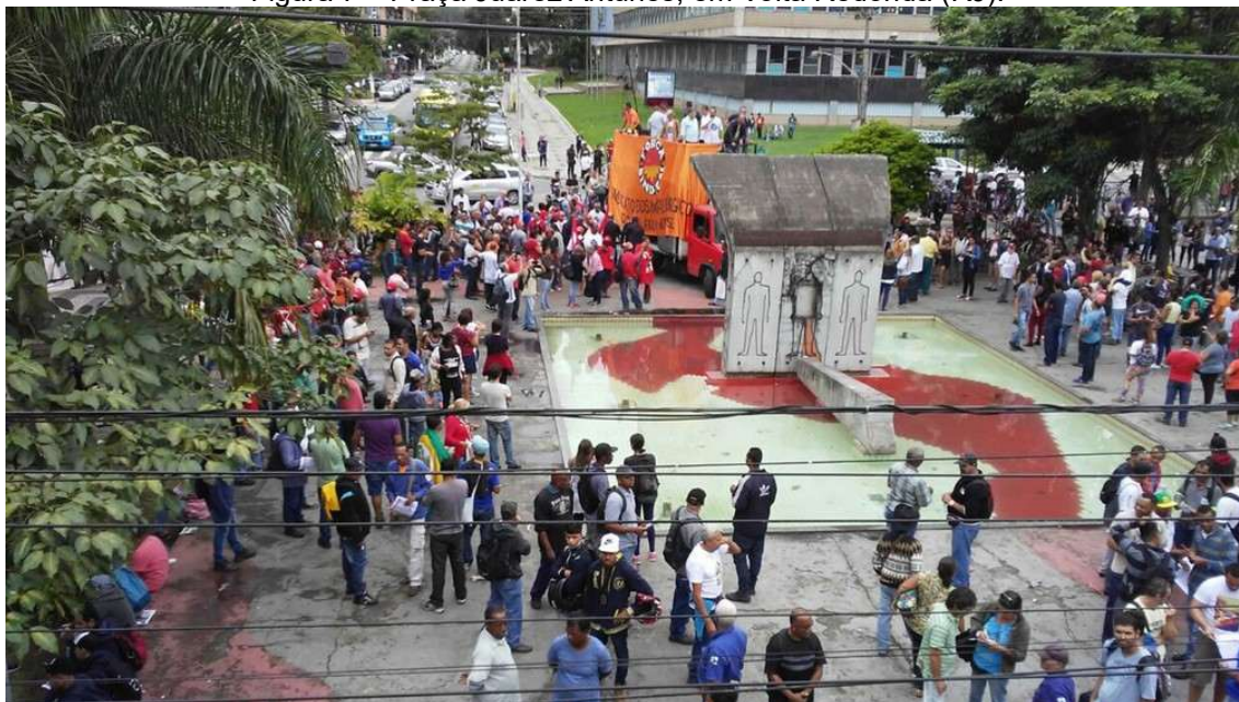
Figura 7 – Praça Juarez Antunes, em Volta Redonda (RJ).

Legenda: Na praça está localizado o Monumento 9 de Novembro, erguido em memória dos três operários mortos durante a repressão à greve da CSN em 1988. O local permanece como ponto de concentração para manifestações, especialmente de caráter sindical.