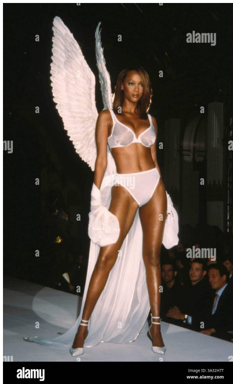
Figura 2: Tyra Banks para Victoria's Secret em 1998