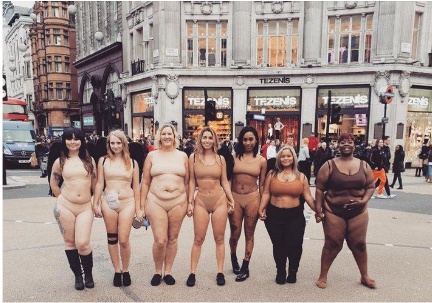
Figura 3: Manifestantes da Nanude em ato contra Victoria's Secret