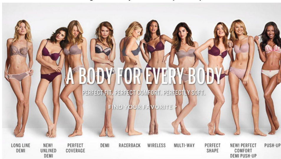
Figura 4: Campanha The Perfect Body

Consequentemente, consumidoras no Reino Unido organizaram uma petição online solicitando que a empresa se retratasse. A petição, intitulada Apologise for, and amend the irresponsible marketing of your new bra range “Body” 6 , reuniu 32.622 assinaturas 7 e teve grande impacto nas redes sociais, fortalecendo o movimento Body Positive 8 e impulsionando hashtags como #iamperfect , em português #eusouperfeita .