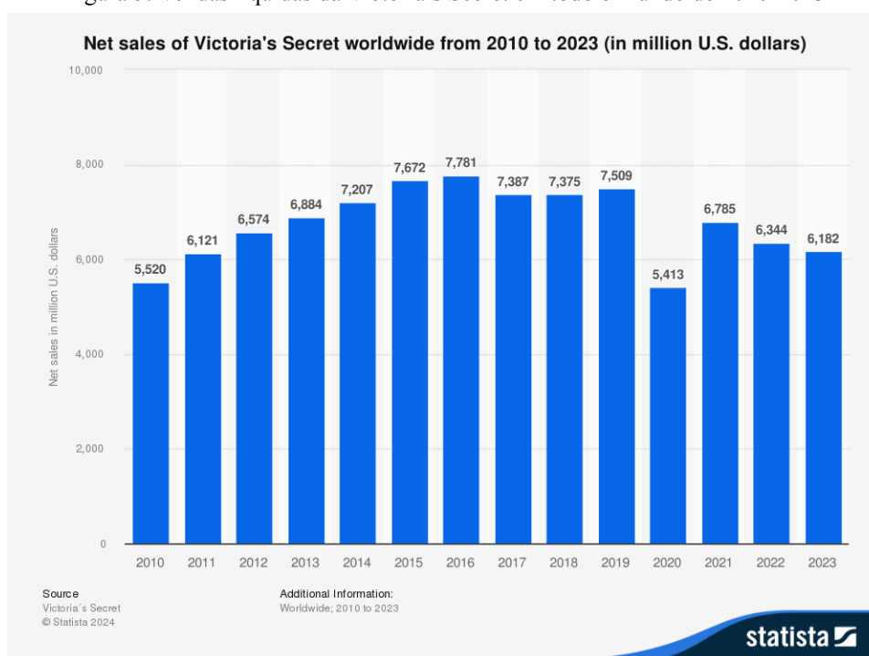
Figura 5: Vendas líquidas da Victoria's Secret em todo o mundo de 2010-2023

Fonte: Statista 2025 https://www.statista.com/statistics/255806/net-sales-of-victorias-secret-worldwide/ . Acesso em jun. 2025.