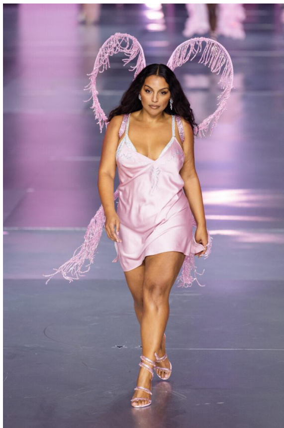
Figura 11: Paloma Elsesser no Victoria's Secret Fashion Show 2024