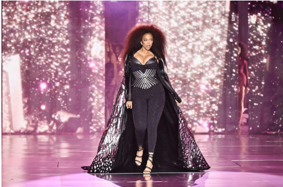
Figura 9: Tyra Banks no Victoria's Secret Fashion Show 2024