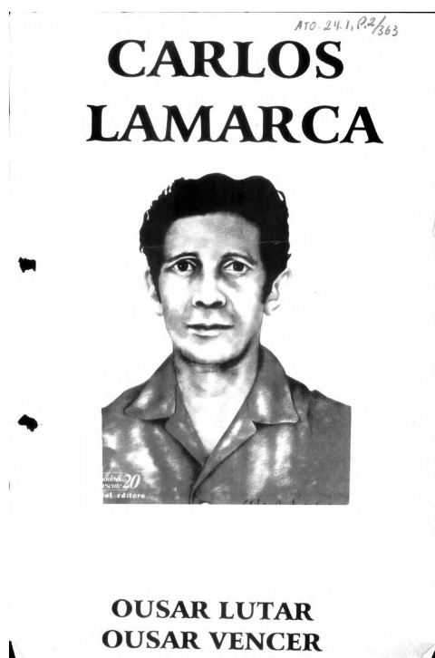
Figura 5: Ilustração Lamarca