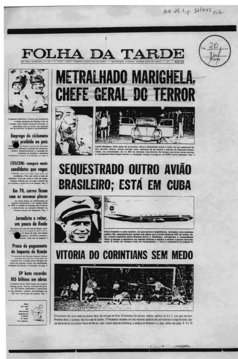
Figura 3 Folha da Tarde de 5 de novembro de 1969

Observamos a manchete “Metralhado Marighella, chefe geral do terror”. Há ainda chamadas sobre o sequestro de aviões ligados a Cuba e sobre uma vitória do Corinthians. A justaposição das três, ainda que não intencional pela editoria, sugere que “Marighella, chefe do terror, por ser comunista, é alguém que se deve combater sem medo”. Retoma-se a antiga discussão sobre o anticomunismo no Brasil, mas convém ampliá-la. Segundo Safatle (2019), o medo constitui o afeto político principal de nossa experiência capitalista atual: