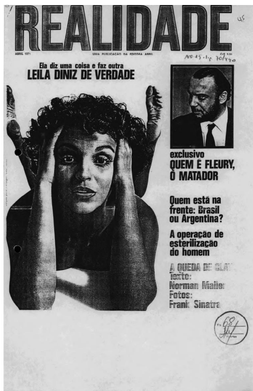
Figura 4: Revista Realidade ,

Outras publicações posteriores à data da morte também aparecem. Em abril de 1971, a revista Realidade estampou esta capa: