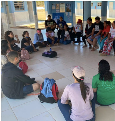
Atividade da PPSUS (2023) – Grupo de pesquisadoras/es se preparando para aplicação de questionário