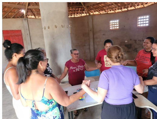
Roda de Conversa, 09.12.24