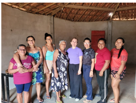
Roda de Conversa, 09.12.24