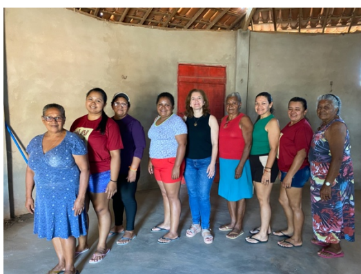
Roda de Conversa, 30.12.24