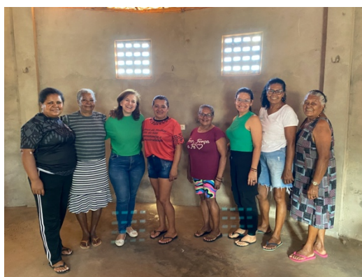
Roda de Conversa, 23.12.24