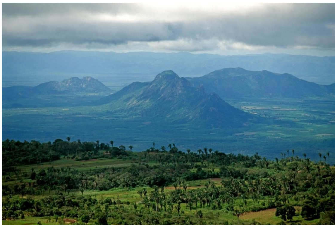
Imagem panorâmica da Serra da Ibiapaba registrada a partir da cidade de Ubajara.