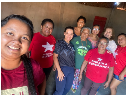
Roda de Conversa, 02.12.24