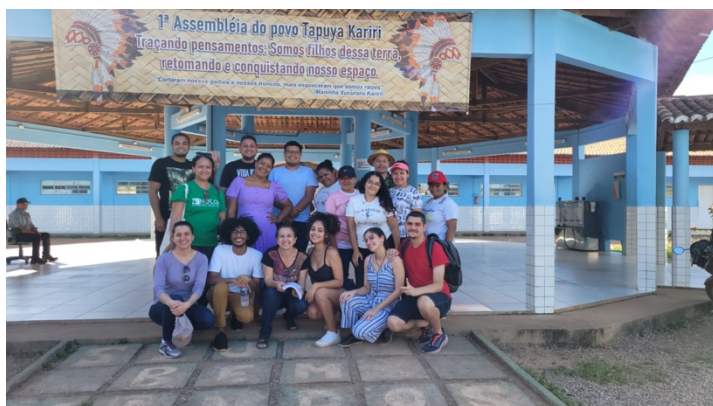
Atividade da PPSUS (2023) – Grupo de pesquisadoras/es finalizando a aplicação de questionário