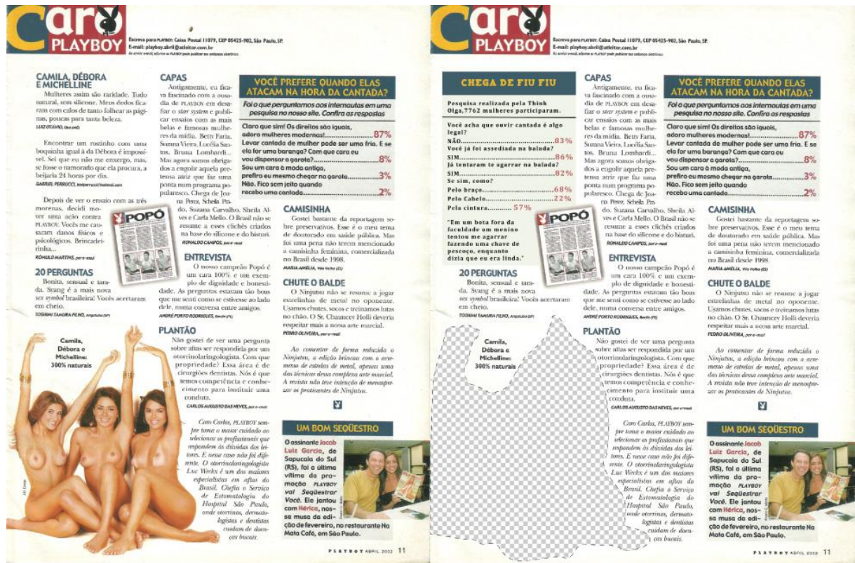
Comparativo “Caro Playboy”.

Como no caso acima, onde, ao invés de retirar o conteúdo original sobre cantadas, foi feita a escolha de colocá-lo em contato com outra pesquisa sobre o mesmo assunto, porém realizada com o público feminino. Ao por em comparação opiniões de homens e mulheres sobre este tema, se pensou em propor o questionamento de como ele pode ser percebido de forma diferente por estas pessoas e se enquadrar como verdadeiros e sérios ataques, diferente da irreverência e diversão sugeridas na pesquisa originalmente apresentada pela Playboy.