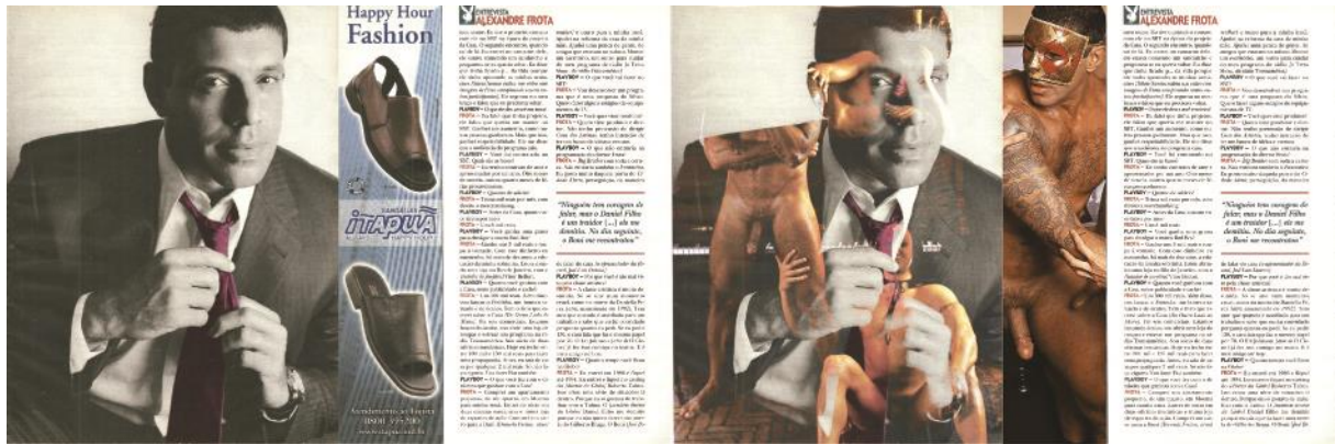
Comparativo “Alexandre Frota”.

Em suas declarações, Frota se refere às mulheres com quem se relacionou, aos homens em quem causou inveja e receio com suas posturas e afirma, dentre outras coisas, que “a Globo não tem mais nenhum galã macho”. Todo o texto gira em torno de reafirmações de sua “macheza”, por características de força, poder e brutalidade supostamente inerentes ao homem. Além disso, é bem fácil lembrar-se de atuais declarações de Alexandre que se vinculam aos discursos misóginos e homofóbicos que circulam no país. Creio que a manutenção do texto original da entrevista atrelada a sobreposição de imagens em que Frota aparece em situações mais vulneráveis – especificamente com outros homens, no contexto de uma publicação voltada para o público homossexual como a G Magazine – se dá como tentativa de mostrar a fragilidade desta norma de masculino sugerida no texto e sua necessidade de atualização às questões e existências contemporâneas.