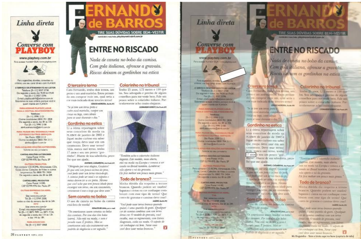
Comparativo “Gordinho na estica”.

Já neste caso, a intenção foi confrontar a aceitação da revista em publicar a questão de um leitor menor de idade – mesmo que sua venda seja proibida para este público – com a recente discussão gerada em torno do clipe de Mc Doguinha. O cantor com idade entre 10 e 12 anos, no clipe em questão, apresenta a música “Vem e brota aqui na base” que conta com a seguinte letra: