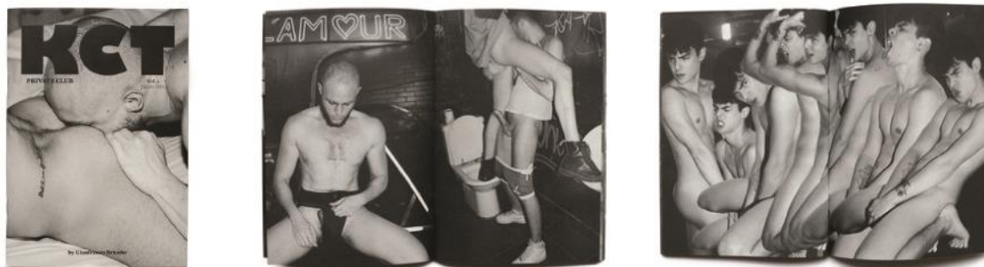
Imagens de divulgação “KCT Zine Volume 1.

Ainda que com estéticas e propostas distintas, percebi infrutífera a comparação dicotômica entre as referidas produções, sob este rumo o trabalho talvez caísse em um juízo de valor, polarizando pornográfico e erótico. Porém, com a intenção de voltar-me aos citados caracteres de pertencimento, deslocamento e transitoriedades comecei a refletir sobre a possibilidade de tratá-los a partir da minha experiência com essas possibilidades imagéticas. De modo que, além de refletir sobre as imagens que consumo atualmente, passei ao questionamento pessoal sobre como se deu meu contato com o gênero pornográfico e quais os possíveis parâmetros de apreciação destas produções eu teria, então, assumido. Assim, voltei à revista Playboy, mais especificamente a edição nº 321 de abril de 2002, primeira publicação de conteúdo relacionado ao pornográfico à qual eu tive acesso.