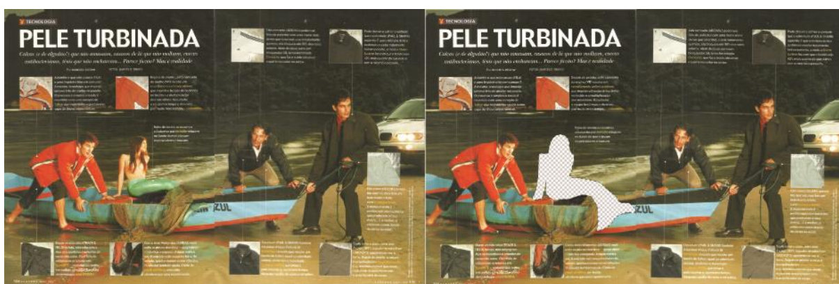
Comparativo “Pele Turbinada”.

Era incômodo o modo como a mulher/sereia estava ali na cena apenas para ornamentá-la, chamando atenção por seu corpo e afins. Em geral, essas imagens sugerem-me como que se as mulheres não estivessem efetivamente nelas, apenas parcelas suas, certas características e fantasias para o olhar do leitor. Logo, qual a diferença de tê-las ou não em cena? O ato de recortá-las seria, de alguma forma, fazer essa questão a este mesmo leitor que apaga aquela pessoa em prol da satisfação própria. Esta mesma estratégia de intervenção foi utilizada em alguns textos, porém preservando as imagens relacionadas aos mesmos. Nestes casos, a intenção era exacerbar especificamente no texto aquilo que soava incômodo ou até mesmo bizarro em alguns destes conteúdos voltados ao prazer e entretenimento masculino. Tais como as possibilidades de objetificação de pessoas transexuais e alusão à zoofilia e pedofilia no exemplo abaixo, à direita destacadas.