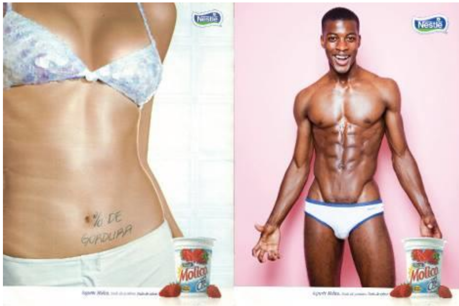
Comparativo “Molico”.

Neste exemplo, eu via problemas nessa repetição de corpos femininos ao longo da revista inclusive nos anúncios. É como se este sempre fosse artifício para o consumo dos homens, mas neste anúncio específico pensei se não havia uma tentativa de atingir um público feminino. Isso porque essa perseguição de um ideal de magreza sempre se destina mais enfaticamente às mulheres, talvez por isso também os produtos “Molico” também tenham uma maior proximidade – em sua comunicação – com o público feminino. Pensei então em substituir a imagem do anúncio por um corpo masculino que parecesse se relacionar com esta preocupação estética expressa na anterior. Deste modo sugerindo uma visão de que homens também se relacionam com aspectos de cuidado de si ou da vaidade propriamente dita.