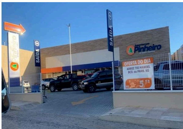
Fig. 5 – Marcas conhecidas começam a investir na região