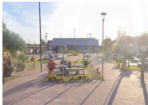
Fig. 6 – Nova praça do Preá