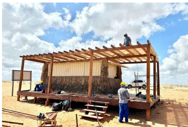
Fig. 8: Instalação de contêiner no PARNA

Levando em consideração todas as explicações, alguns locais espalhados pela vila Preá apresentam situações que se enquadram em, pelo menos, duas das três vulnerabilidades existentes. Como destaque inicial, está a instalação de contêineres por parte de empresas do setor imobiliário no perímetro pertencente ao Parque Nacional de Jericoacoara (PARNA), com o intuito de ser uma base de apoio para praticantes de kitesurf (Figura 8). Contudo, residentes na região se preocupam com possíveis impactos ambientais provocados por essa medida, questionando até a permissão por parte do Instituto Chico Mendes de Conservação da Biodiversidade, o ICMBio (O POVO, 2024).