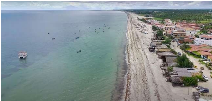
Fig. 9: Proximidade do mar para as barracas de praia

Ainda assim, os efeitos do avanço da urbanização a partir de tempos anteriores em zonas próximas do parque fizeram com que a possibilidade de alagamentos aumentasse nos períodos chuvosos, por causa da interrupção dos sistemas de drenagem e considerando as vulnerabilidades sociais e ameaças naturais. Além disso, as barracas e outras construções presentes, como quiosques, na faixa de praia sofrem com o avanço do mar e das dunas (Figura 9), fazendo com que a desocupação forçada seja algo comum entre aqueles que buscam uma fonte de renda por meio da atividade turística (PROJETO ORLA DE CRUZ-CE, 2023).