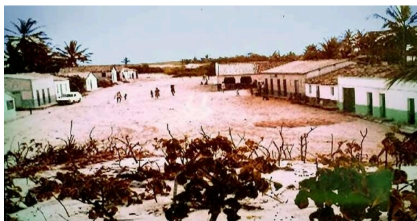
Fig. 2 – Imagem da Vila Preá no ano de 1985

Avançando até o século XX, os habitantes da pequena vila trabalhavam em atividades ligadas a pesca ou então na parte do artesanato, levando assim uma vida com bastante tranquilidade e sem nenhuma precisão de pressa. Ademais, os descendentes de cada família seguiam as mesmas profissões de seus pais, um costume presente em partes do litoral e do interior cearense. Já em relação as condições financeiras dos moradores, a imensa maioria estava inserida na classe menos favorecida, visto que as tarefas exercidas tinham como prioridade a subsistência. Abordando um pouco sobre a infraestrutura, as estradas não possuíam condições adequadas de uso por serem constituídas de materiais como barro e areia, sendo que o asfalto era até então uma realidade improvável. No que diz respeito ao formato das casas, elas foram construídas com portas e janelas em grandes tamanhos (Figura 2), um elemento arquitetônico dominante nesse perímetro.