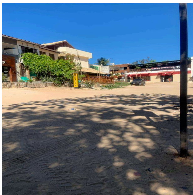
Fig. 1 - Presença de pontos comerciais e pousadas em Jericoacoara

No simples ato de andar pelas ruas da vila, é perceptível logo de início que para se chegar até o local se faz necessário andar por dentro do Parque Nacional, ou seja, numa zona de predominância de dunas. Por causa disso, existe uma grande preocupação na preservação desse tipo de relevo, pois muitos veículos (caminhonetes e buggys ) trafegam pelo local utilizando como via de acesso. Uma consequência dessa proteção está na não abrangência do tamanho da vila, sendo que possíveis novos empreendimentos e casas de temporada estão proibidos de serem construídos na delimitação do parque, em prol de evitar possíveis impactos ambientais. Chegando na localidade, com muita facilidade podem ser encontrados hotéis, pousadas, lojas, restaurantes, dentre outros serviços que tentam se encaixar numa área com pouco espaço e ruas estreitas, apontando que os imóveis construídos para tais finalidades buscam o seu espaço (Figura 1).