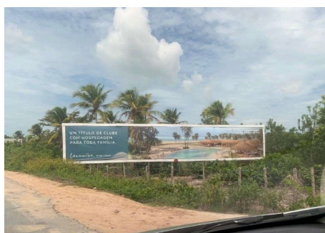
Fig. 7: Anúncio de venda de condomínio

Seguindo tal raciocínio, alguns grupos imobiliários viram uma oportunidade de expandir seus negócios com a introdução de resorts , hotéis- resorts , bangalôs e aproveitando o ambiente vantajoso para a prática de esportes náuticos, modificando de forma intensa todo o aspecto que envolve a paisagem da vila Preá e proximidades (Vieira; Pereira, 2024). Num passeio pelas ruas e vias de acesso da localidade, se encontram muitos outdoors com divulgação de loteamentos e condomínios que já foram concluídos ou estão em fase de obras (Figura 7). Além disso, é uma cena comum notar operários trabalhando na construção de casas de uso ocasional.