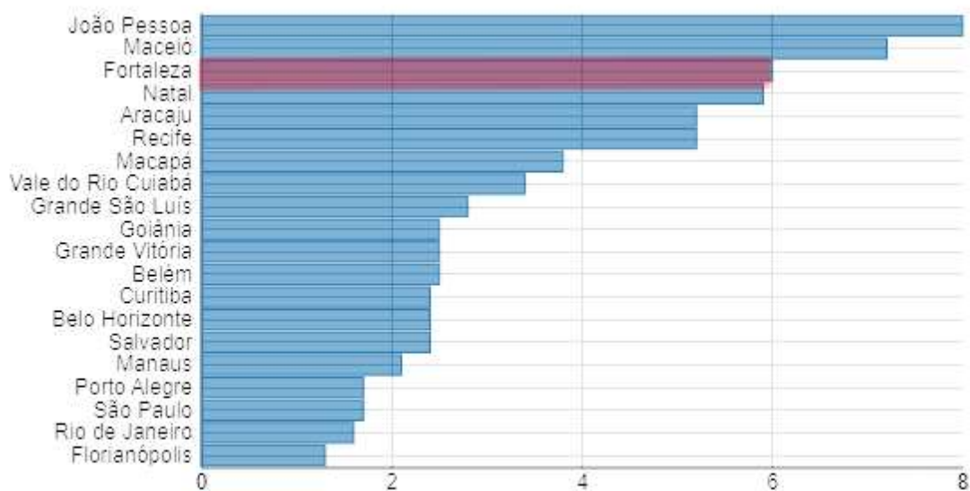
Gráfico 1 – Analfabetismo nas Regiões Metropolitanas do Brasil (2022) 24