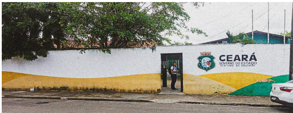
Figura 2 - Frente da escola A, com o símbolo da Secretaria de Educação do Estado do Ceará, pintada em branco, amarelo e verde