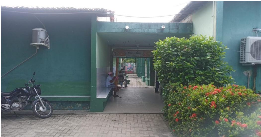
Figura 1 - Recepção da escola A, Portão de entrada com plantas, local de espera para atendimento e secretaria da escola

O lócus da pesquisa será em uma escola pública do Estado do Ceará, de ensino médio regular, localizada no bairro Jangurussu, no Município de Fortaleza.