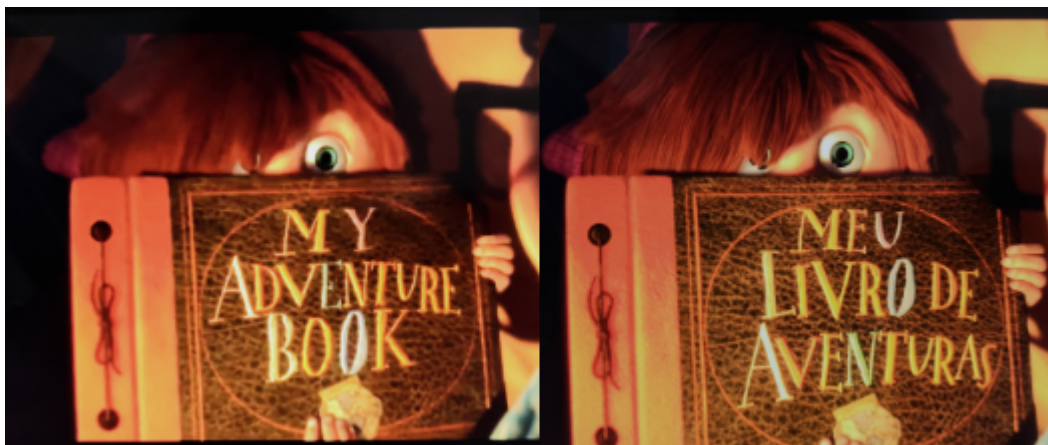
Figura 4 - Capturas do filme Up: Altas Aventuras ilustrando a cena em que

Ellie mostra para Carl o seu livro de aventuras.