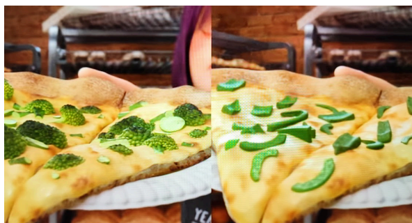
Figura 3 - Capturas do filme Divertidamente ilustrando a versão em língua inglesa (esquerda) e a tradução transmitida no Japão (direita).

Na tradução japonesa de Divertidamente (2015), os animadores decidiram representar pedaços de pimentão verde, considerando que o brócolis, que aparece na versão original, é geralmente muito apreciado no Japão. Essa decisão demonstra que, caso o brócolis tivesse sido mantido, a aversão da protagonista Riley não seria facilmente compreendida pelas crianças japonesas.