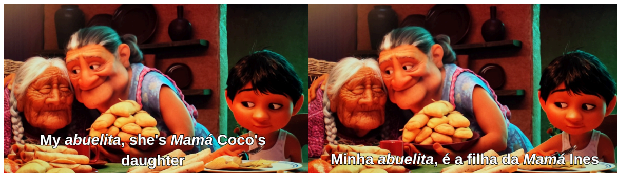
Figura 2 - Capturas do filme Viva: A Vida É Uma Festa ilustrando a cena em que Miguel fala sobre sua avó, na língua inglesa (esquerda) e portuguesa (direita).

especificidades culturais da língua de origem e proporcionando ao público uma conexão mais direta com o contexto cultural do filme. Essa abordagem reflete a estratégia de estrangeirização, ao preservar as particularidades linguísticas e culturais, mesmo ao adaptar o conteúdo para um novo público.