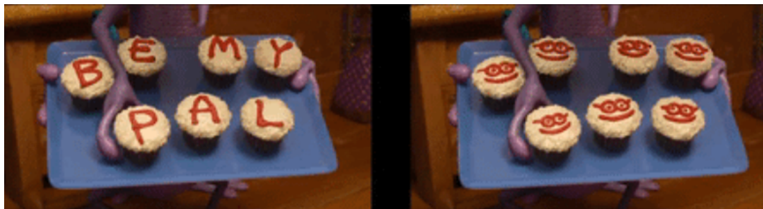
Figura 5 - Capturas do filme Universidade Monstros ilustrando o texto-fonte original inglesa (esquerda) e a tradução adaptada para países não falantes da língua inglesa (direita).

forma eficaz em mais de 30 idiomas. Assim, na maior parte do mundo a frase foi trocada por desenhos de rostos felizes.