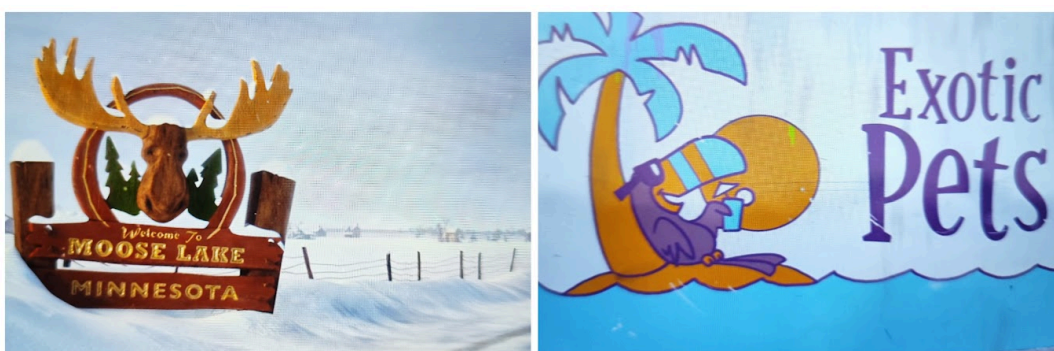
Figura 7 – Capturas de tela do filme Rio (2011) ilustrando elementos visuais em inglês nas cenas ambientadas em Minnesota.

Embora Rio seja um filme ambientado no Brasil sob a visão de outro país, ele apresenta poucas ocorrências de estrangeirização na tradução dublada para o português brasileiro. Em comparação com outros filmes da Pixar, nos quais há adaptações visuais para adequar o conteúdo ao público local, Rio mantém algumas características em inglês, principalmente em elementos visuais e sonoros. Um possível motivo para a presença de elementos em inglês, como placas e sinais visuais, é marcar essa mudança de ambientação e destacar a diferença cultural entre os dois cenários. Segundo Venuti (1995), a estrangeirização é uma estratégia que preserva as marcas culturais e linguísticas do texto original, ainda que isso provoque certo estranhamento no público-alvo. Nesse contexto, a escolha de manter o inglês em elementos visuais funciona não apenas como uma estratégia de preservação cultural, mas também como um recurso narrativo que sinaliza a transição geográfica e cultural entre os espaços da trama.