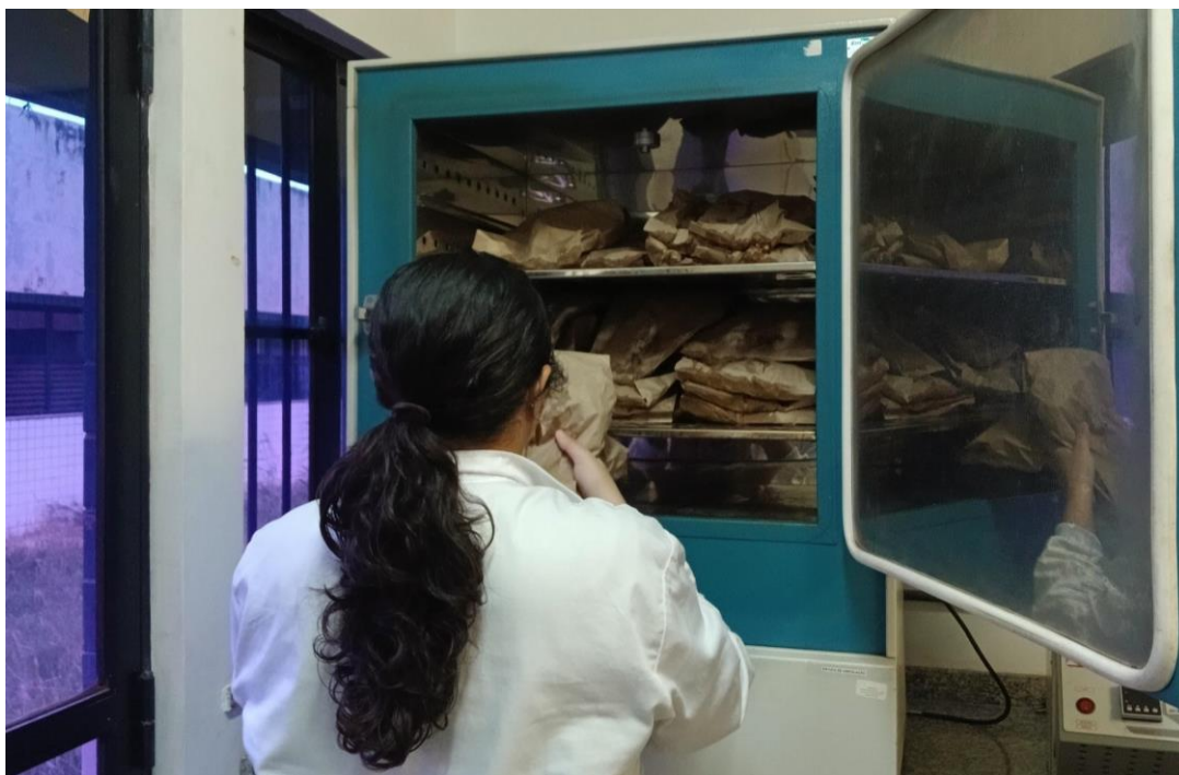
Figura 4 - Acondicionamento das amostras em estufa de circulação forçada de ar a \pm 65\text{ }^{\circ}\text{C}