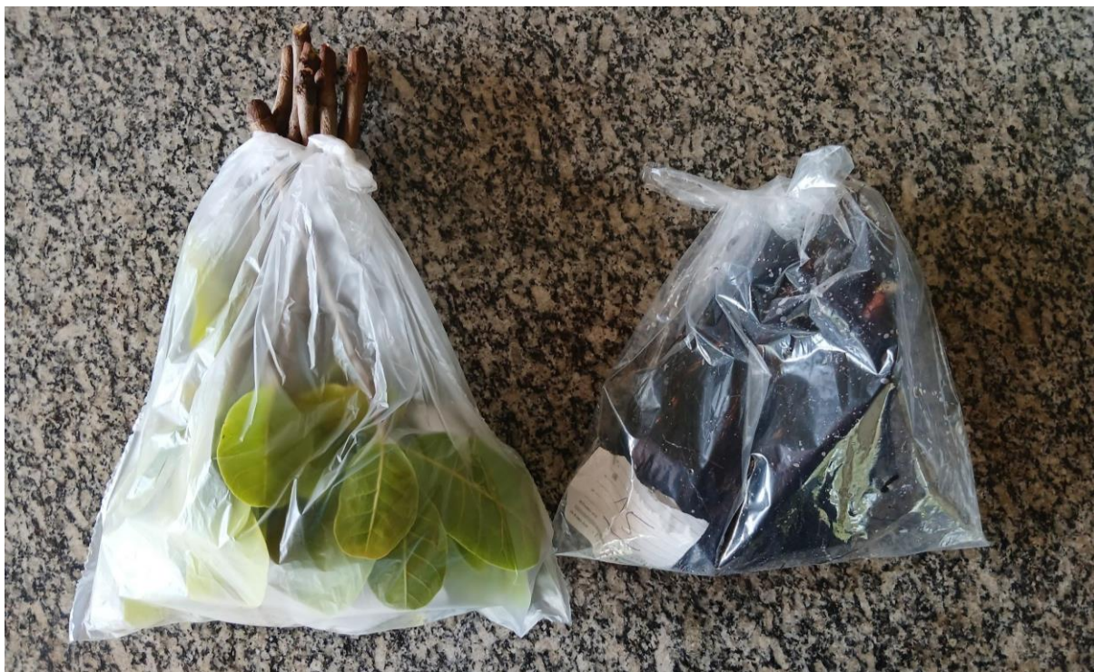
Figura 3 - Parte aérea e raízes das mudas enxertadas de cajueiro, acondicionadas em sacos plásticos