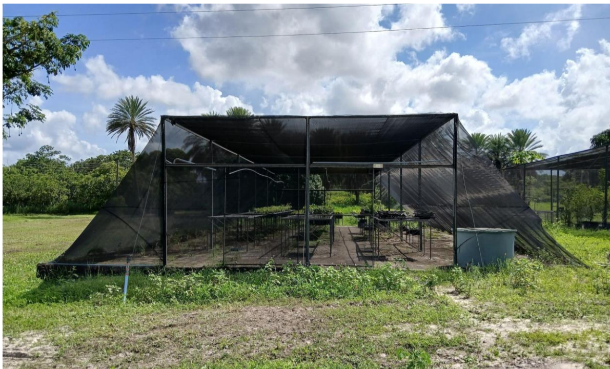
Figura 1 - Telado de produção de mudas de cajueiro com 50 % de sombreamento

A enxertia dos genótipos-copa foi realizada entre os dias 07 e 10 de outubro de 2024. Os garfos dos genótipos-copa foram obtidos dos jardins clonais de cajueiro, no Campo Experimental de Pacajus. Os garfos selecionados apresentavam diâmetro entre 4,5 mm e 6,0 mm, como recomendam Serrano e Cavalcanti Junior (2016), e foram enxertados e protegidos com saco plástico transparente, assim, garantindo a conservação da umidade. Os tubetes foram mantidos em viveiro com 50 % de sombreamento (Figura 1). Cerca de 45 dias após a enxertia (DAE) as bandejas com os tubetes foram transferidas para canteiro a pleno sol e mantidas até o fim do experimento (Figura 2).