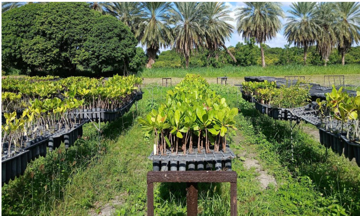
Figura 2 - Canteiros de produção de mudas de cajueiro a pleno sol