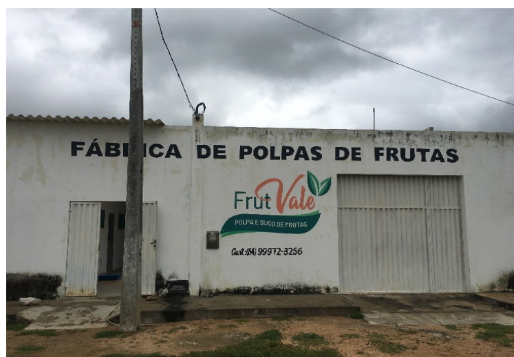
Figura 12 – Fábrica de polpa de fruta. Associação Sítio Rio Novo