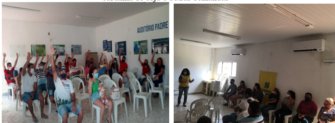
Figura 09 - Reunião da AMPC - Votação sobre o arrendamento da indústria de beneficiamento de castanha de caju e outras demandas

A diretoria é composta por presidente e vice, tesoureiro e vice, secretário e vice, além de membros do conselho fiscal. As eleições são realizadas a cada dois anos. A composição da diretoria é diversificada, incluindo jovens, mulheres e homens. As decisões são tomadas de forma coletiva, em conformidade com os princípios do associativismo, sendo as demandas apresentadas aos membros da associação e submetidas à votação para a aprovação ou não.