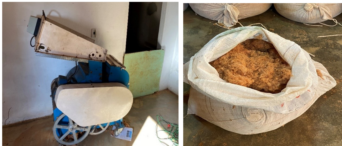
Figura 16 – Descaroador de Algodão agroecológico/algodão descaroadado

previamente definidos para a comercialização. O cultivo pode ser realizado tanto nos lotes individuais de cada agricultor quanto, por decisão coletiva, na área comum do assentamento.