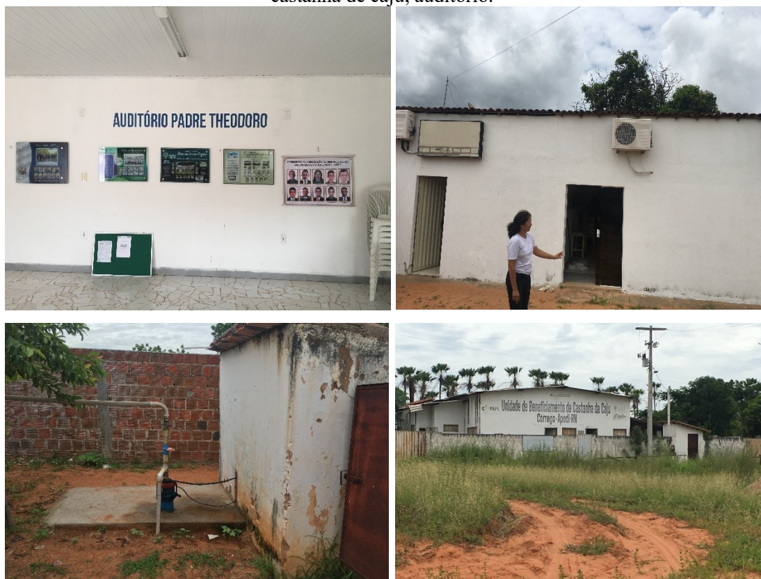
Figura 10- Estrutura física da sede da associação: poço tubular, indústria de beneficiamento de castanha de caju, auditório.

beneficiamento de castanha de caju encontra-se inativa, e há discussões em andamento sobre a possibilidade de arrendar o espaço para terceiros 17 .