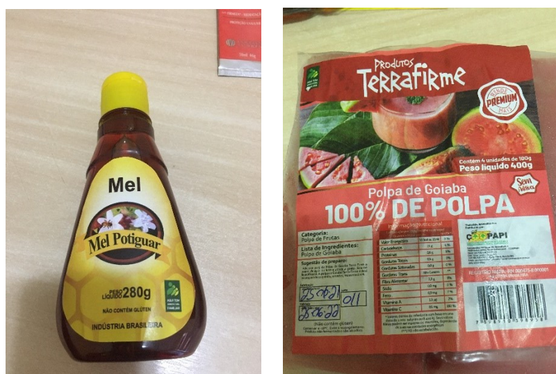
Figura 04 – Mel e polpa de fruta – COOPAPI

O mercado institucional consiste na venda direta de produtos ao Estado, por meio da participação em editais e chamadas públicas. Os principais compradores são o Programa Nacional de Alimentação Escolar – PNAE e o Programa Nacional de Acesso à Alimentação – PNAA. Com o entreposto de beneficiamento de mel, a produção de castanhas beneficiadas e a polpa de frutas, vislumbra-se a ampliação para outros mercados, como supermercados e o comércio varejista.