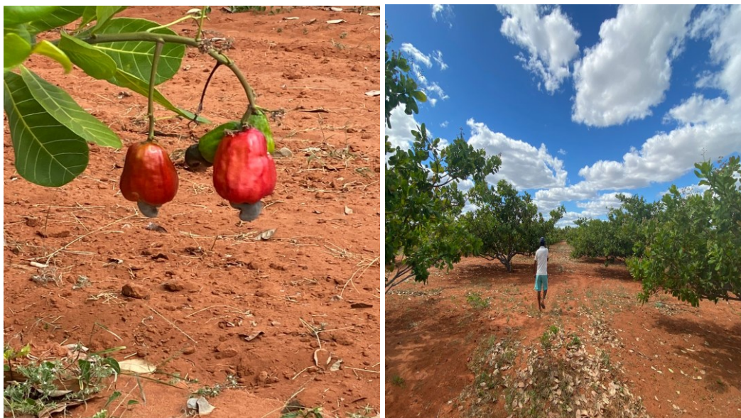
Figura 18 – Produção de caju do Assentamento Portal da Chapada