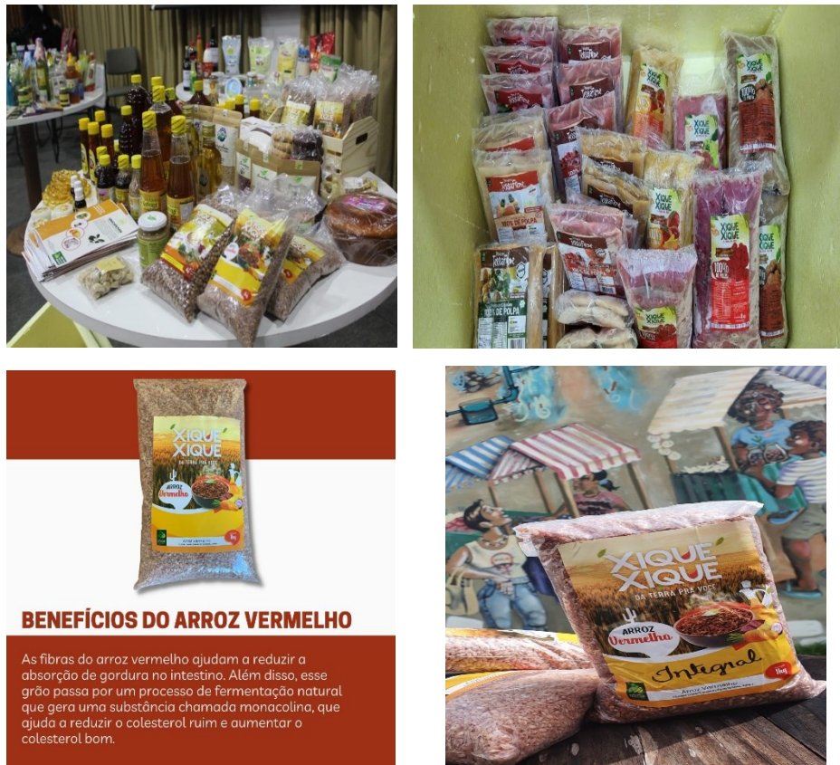
Figura 07 - Produtos Comercializado Pela Rede Xique-Xique de Comercialização Solidária