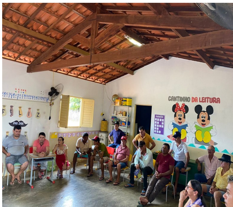
Figura 17 – Reunião da Associação do Projeto de Assentamento Portal da Chapada

As reuniões da associação com os agricultores e agricultoras associados, visando otimizar o intercâmbio organizativo com outras comunidades, são realizadas no terceiro domingo de cada mês na sede da escola primária da comunidade. Segundo o nosso interlocutor, a adesão a essas reuniões é expressiva, com mais de 80% dos associados participando regularmente e contribuindo para os debates.