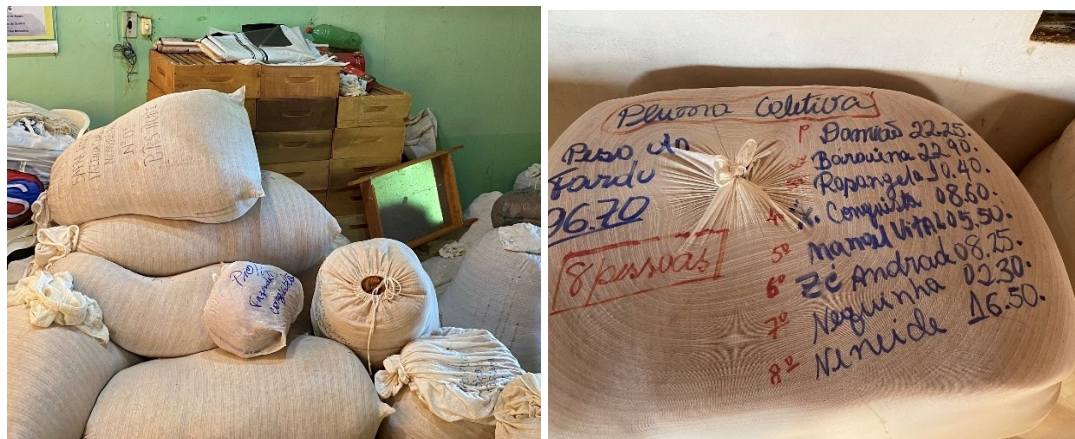
Figura 15 – Algodão agroecológico produzido no Projeto de Assentamento Milagres

algodão é cultivado de forma consorciada com outras culturas, como feijão e gergelim, seguindo os princípios da agroecologia e promovendo a sustentabilidade no uso da terra.