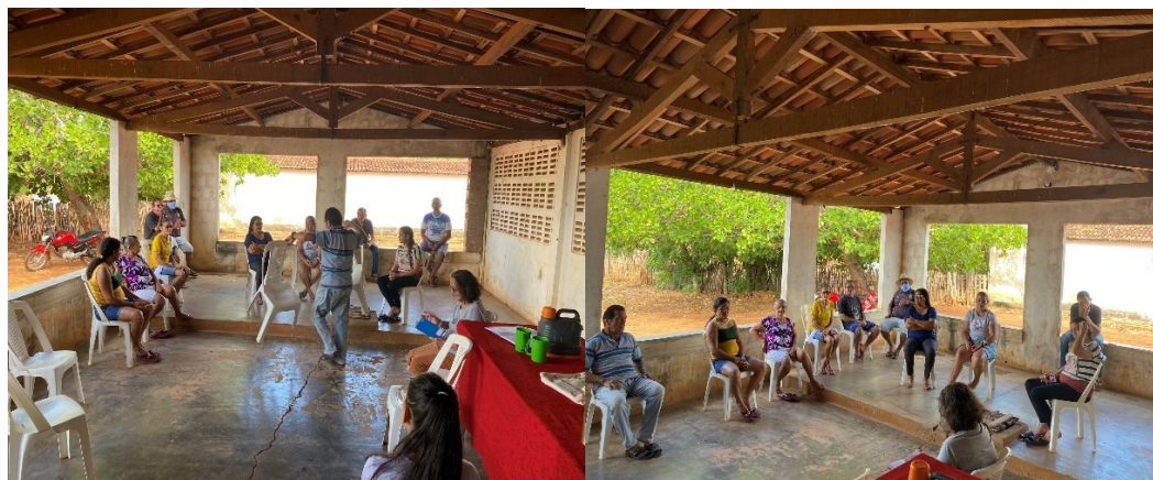
Figura 14 – Reunião mensal da associação do Projeto de Assentamento Milagres

Do ponto de vista jurídico, a associação está legalizada e possui um CNPJ ativo. Em termos de organização, as reuniões com os associados ocorrem toda primeira segunda-feira do mês; em casos extraordinários, as reuniões podem ser remanejadas para outro dia da semana. Segundo nossa interlocutora, essas reuniões sempre contam com boa representatividade e debates acalorados, como tivemos a oportunidade de acompanhar pessoalmente em algumas ocasiões.