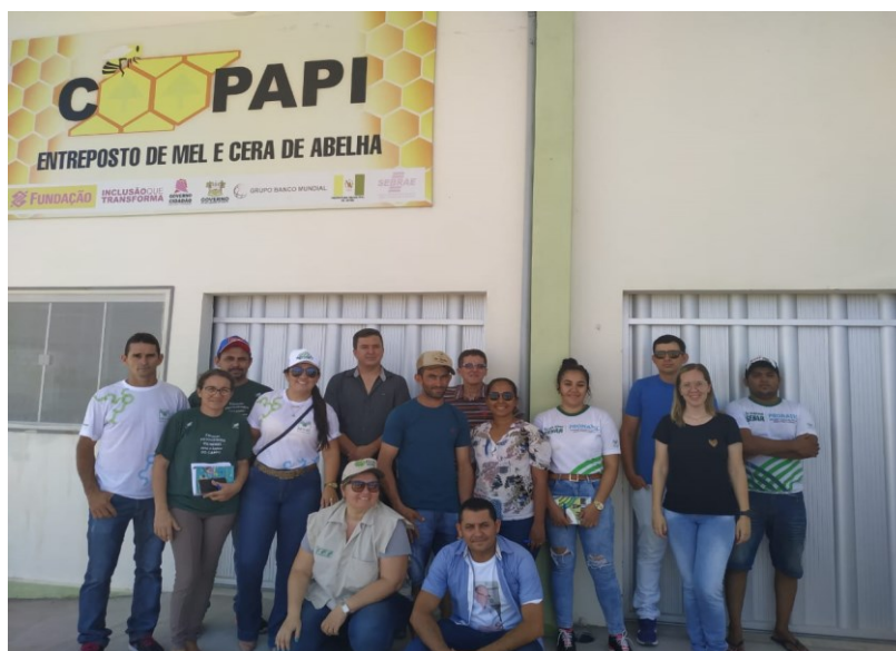
Figura 03 – Entreposto de Mel e Cera - COOPAPI

Como patrimônio próprio, a cooperativa possui uma área de um hectare (100x100 metros), onde está em fase final de construção um entreposto de beneficiamento de mel. Segundo nosso interlocutor, a estrutura, incluindo equipamentos, representa um investimento aproximado de um milhão e meio de reais. Os recursos para a construção foram obtidos por meio de créditos bancários e auxílios financeiros do poder público.