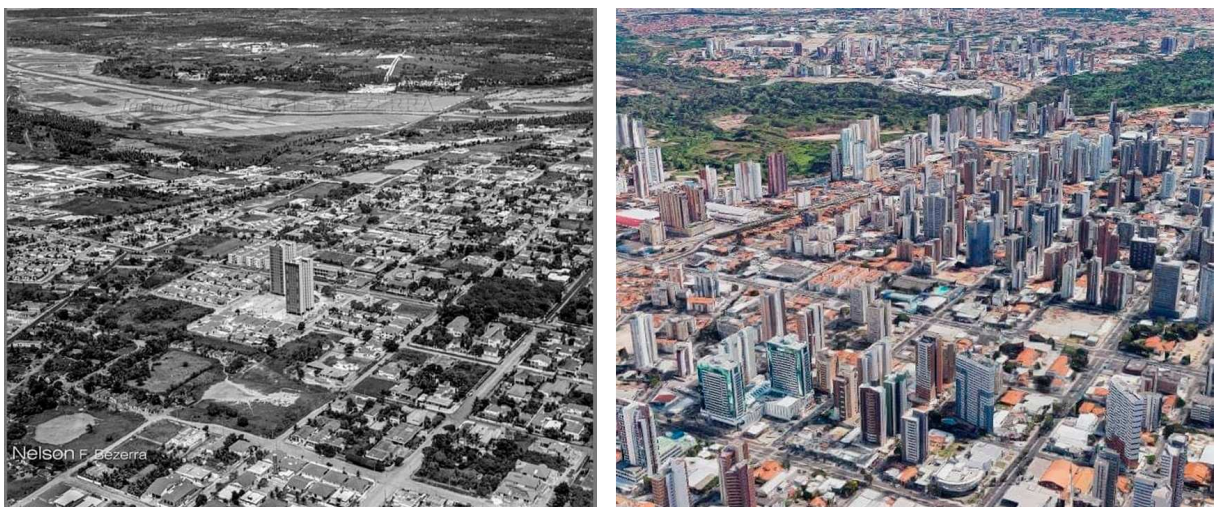
Figura 2 – Comparativo da paisagem urbana de Fortaleza (Anos 70 – 2000):

1