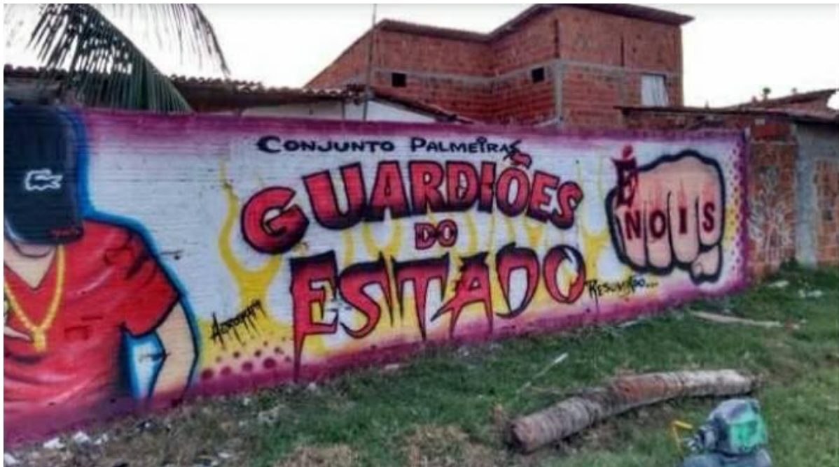
Figura 11 – Mural no bairro Conjunto Palmeiras.