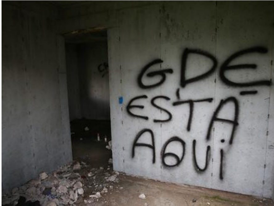
Figura 8 – Pichações dentro de conjunto habitacional em construção.

temendo por suas vidas casos não abandonem seus lares. Hoje Facções podem determinar quem fica em quem sai, quem vive e quem morre em determinado bairro (FILHO; MARIANO, 2020).