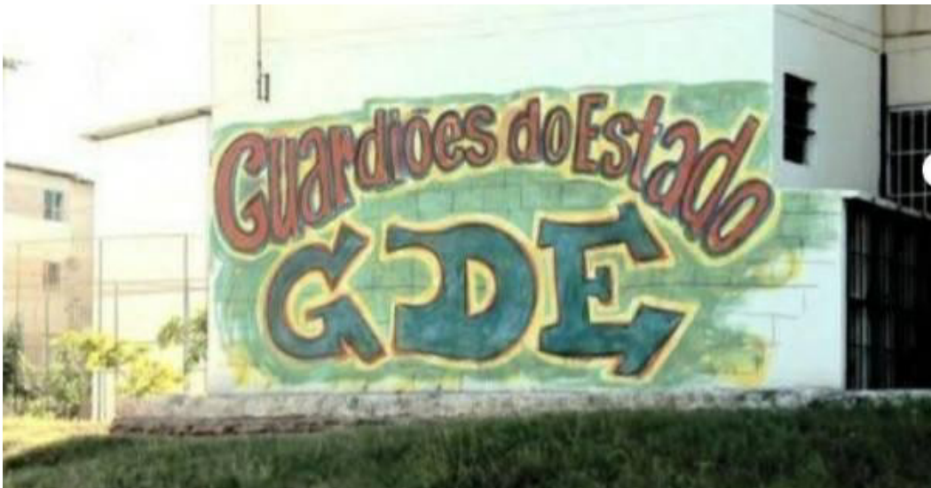
Figura 12 – Mural Guardiões do Estado