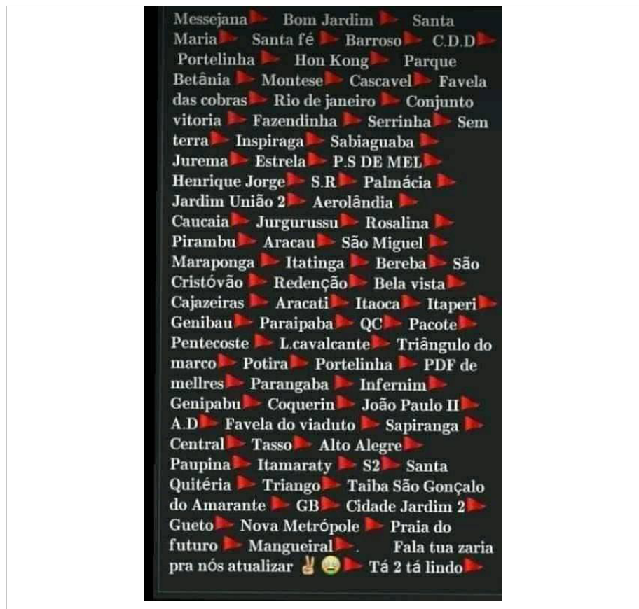
Figura 3 – Corrente de Whatsapp com supostas localidades em Fortaleza e região metropolitana com membros do comando vermelho: