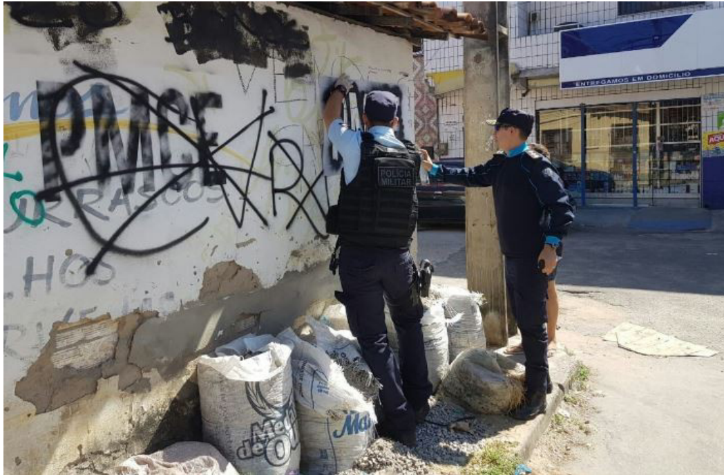
Figura 14 – Policiais Militares cobrem pichações de facções em Fortaleza.