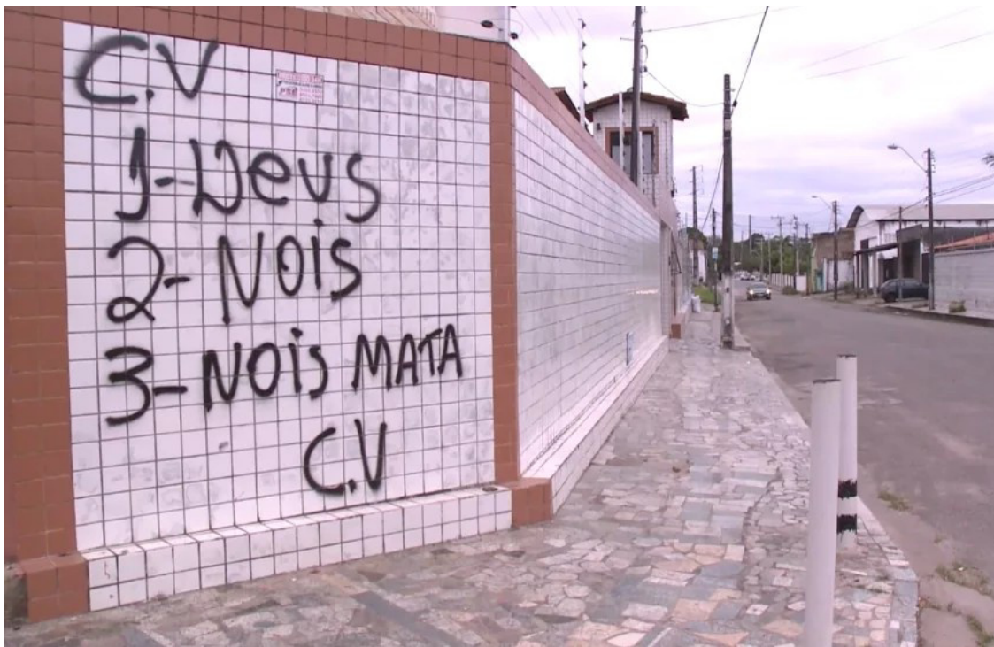
Figura 4 – Pichação No bairro Presidente Kennedy

Essas intervenções junto com os primeiros rumores de que novas lideranças aliadas as facções haviam passado a dominar pontos de vendas de drogas espalhados pela cidade, a pichação teve então um papel inicial importante para estabelecer a presença dos símbolos desses grupos no cotidiano, principalmente dentro das periferias. Como podemos ver na Figura 4.