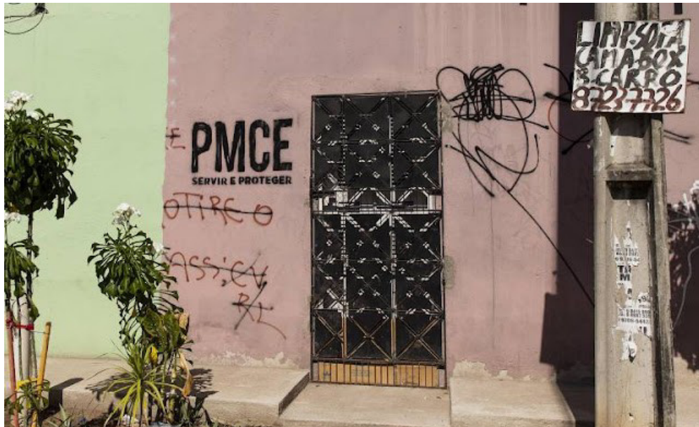
Figura 13 – Parede de favela em Fortaleza tem pichação de facção criminosa e da Polícia Militar do estado:

Ao tentar se incorporar nesse circuito, essas novas intervenções mostram que os elementos envolvidos nas questões de segurança pública, tem conhecimento do poder da pichação na manutenção desses coletivos dentro das comunidades, sendo a pichação uma fonte de estudo das relações do crime com o território da cidade, da filosofia e modo de atuação das facções que desafiam o próprio estado.