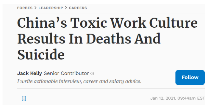
Figura 4 – Forbes

O site Forbes , conhecido por suas notícias abordando o mercado de trabalho, teve uma publicação falando sobre a cultura de trabalho na China, como representado na Figura 4.