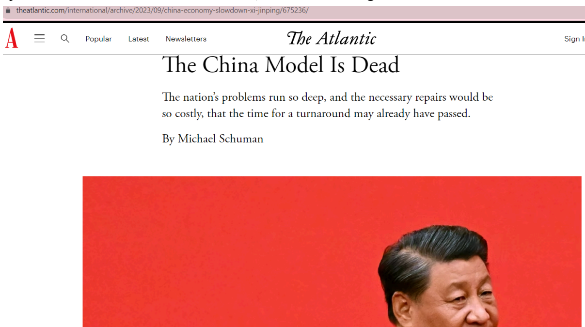
Figura 3 – Resultado encontrado em uma busca utilizando o nome “China”

No site de notícias americano The Atlantic , uma rápida busca pelo nome “China”, levará a uma grande quantidade de notícias relacionadas, uma em particular chama atenção para ser utilizada na análise do discurso, como visto na Figura 3.