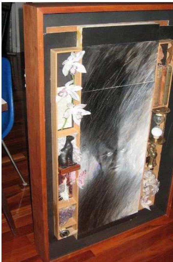
Figura 2 - foto dos bastidores da primeira capa de Sandman .

Embora a capa seja um elemento autônomo, a composição apresentada dialoga com a linguagem dos quadrinhos ao propor imagens justapostas em painéis, com um layout que poderia ser facilmente aplicado a uma página. Em relação a este layout, um elemento fundamental para a análise é o reconhecimento de como se deu seu processo criativo, que segue o mesmo procedimento nas edições seguintes: a confecção de uma peça física e a posterior fotografia desta para a criação da capa final.