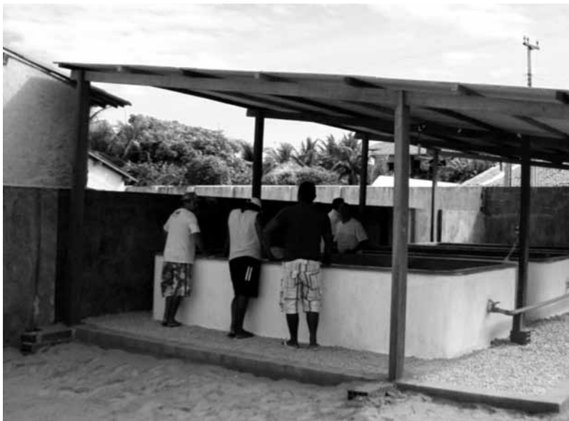
Figura 1 - Tanque para recepção de lagostas vivas na comunidade de Caponga, Município de Cascavel/CE.

aos custos fixos e variáveis para montagem dos tanques se encontram na Tabela I.