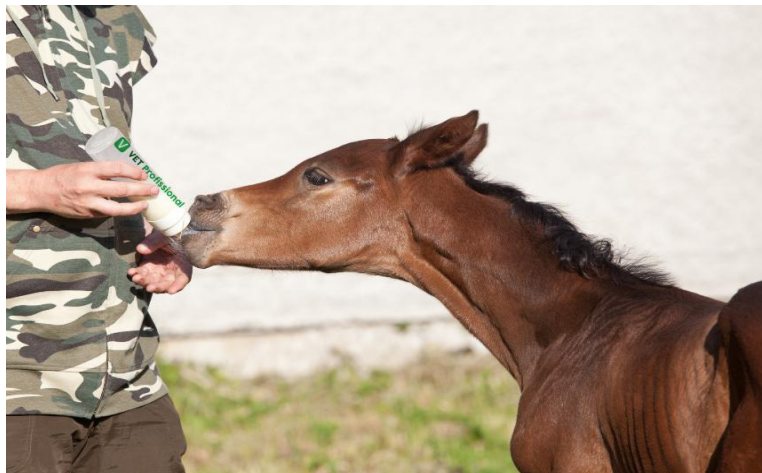
Figura 3 – Leite fornecido através da mamadeira.