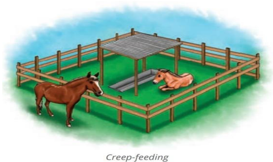
Figura 2- Sistema Creep feeding