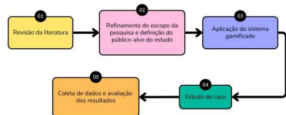
Figura 1: Metodologia do estudo

Para o melhor detalhamento do processo, esta Seção segue a organização exposta na Figura 1.