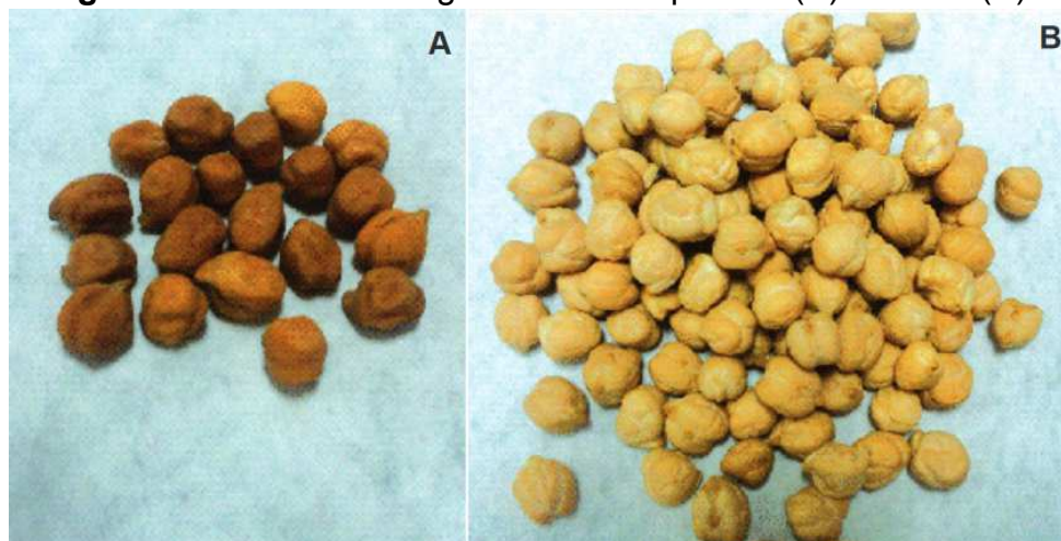
Figura 1 – Sementes de grão-de-bico: tipo desi (A) e kabuli (B).

Participante da família Fabaceae, possui dois cultivares: tipo desi (Figura 1A), que as sementes apresentam vários tons e varia de marrom, amarelo, verde e preto possuindo formatos angulares com superfície rugosa e, o tipo kabuli (Figura 1B), dispondo de sementes brancas ou beges de tamanho maiores, tegumento fino e liso (NASCIMENTO, 2016; SHARMA, 1984).