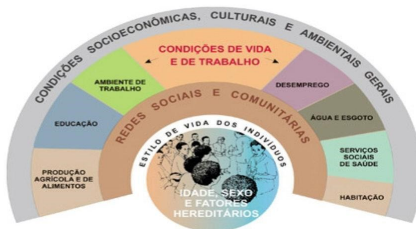
Figura 2- Modelo Adaptado de Dahlgren e Whitehead