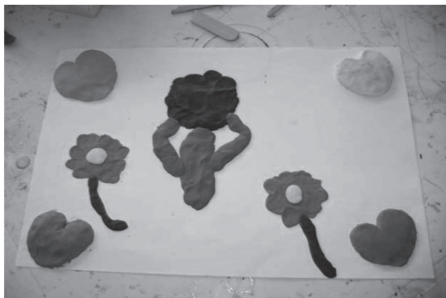
Figura 1 - Nesse desenho tem corações, árvores e flores que, juntos, formam um bonito quadro representando a minha felicidade [...]. (P3)

Algumas mulheres tinham histórico de abortos porque desenvolveram DMG em gravidezes anteriores. A alegria pela nova oportunidade de ter filhos, bem como a esperança de levar a gestação a termo e ter uma criança saudável, permeavam seu cotidiano. Ao complementar a descrição de sua vivência por meio do desenho (Figura 1), uma das participantes expressou que, apesar de tudo, ainda tinha muitos motivos para comemorar.