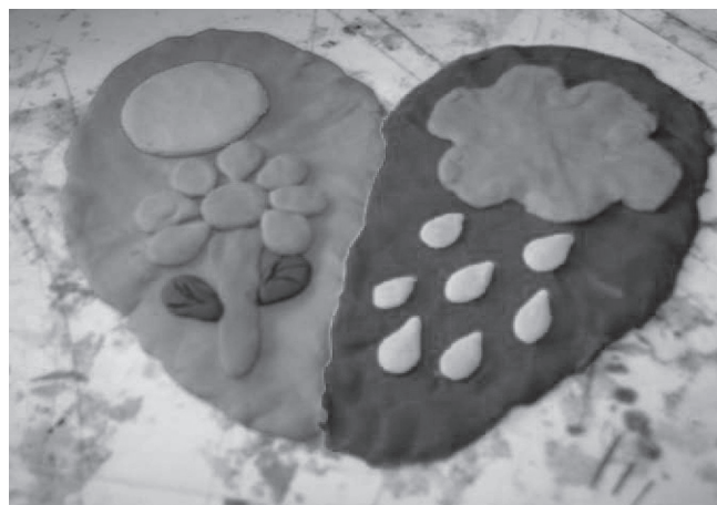
Figura 2 - Os dias de chuva representam a tristeza pela dificuldade de acesso à hospitalização, e os dias de sol, a alegria de ter iniciado o tratamento. (P1)

Os sentimentos que emergiram desse discurso também foram manifestados por meio do desenho (Figura 2), que ilustra a transformação da tristeza em alegria.