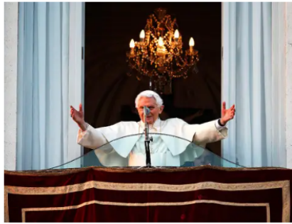
1/79 Papa Bento XVI acena para os fiéis pela última vez da sacada de sua residência de verão em Castel Gandolfo

O papa Bento XVI, de 85 anos, surpreendeu o mundo, nesta segunda-feira, ao anunciar que vai renunciar ao pontificado no próximo dia 28 de fevereiro. Em comunicado, Bento XVI, de 85 anos, afirmou que vai deixar o cargo devido à idade avançada, por “não ter mais forças” para exercer o comando da Igreja Católica e que está “totalmente consciente da gravidade de seu gesto”.