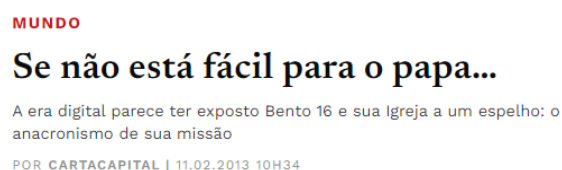
Figura 18: Carta Capital - Matéria 2 – Título

A segunda matéria publicada pela Carta Capital, embora não apresente uma autoria definida, possui um tom opinativo, se utilizando de figuras de linguagem e com uma linha política progressista bem definida.