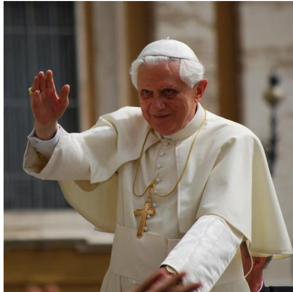
Figura 1: Joseph Ratzinger - Papa Bento XVI