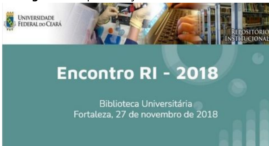
Figura 3 – Apresentação do Encontro RI 2018

Realizado no auditório da Biblioteca Central do Campus do Pici, com a participação de 28 representantes de suas respectivas bibliotecas, o evento proporcionou aos operadores do DSpace a oportunidade de discussão geral sobre o trabalho desenvolvido no RI/UFC, abordando temas como a recuperação das informações incluídas na plataforma e os benefícios desse serviço para a Universidade.