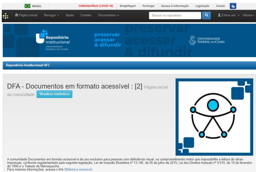
Figura 1 – Comunidade DFA-RI/UFC (documentos em formato acessível)