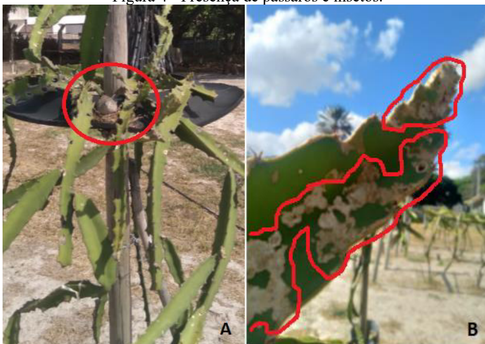
Figura 4 - Presença de pássaros e insetos.

Legenda: A = Ocorrência de pássaros. B = Danos causados por formigas.