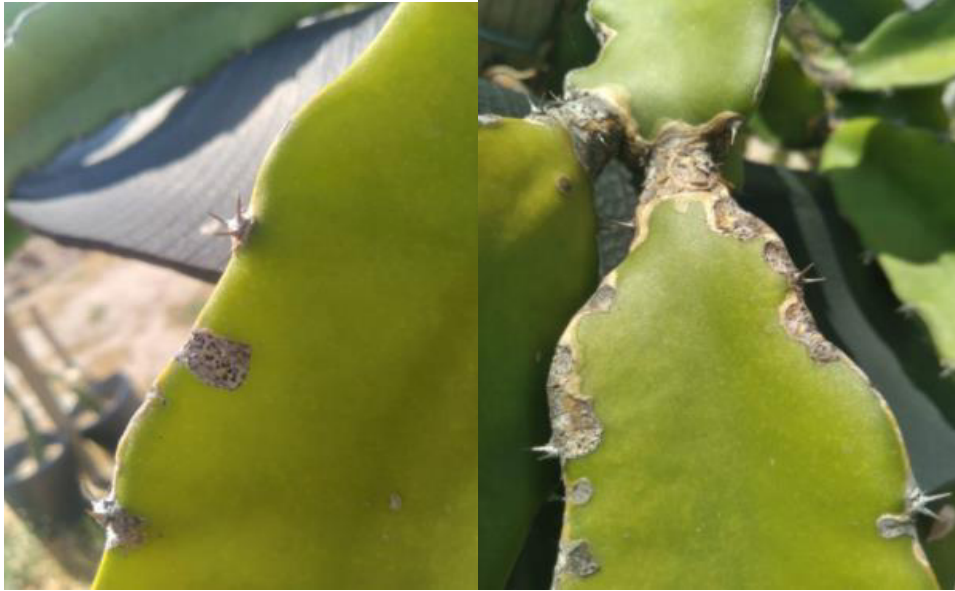
Figura 1 - Presença de Antracnose.