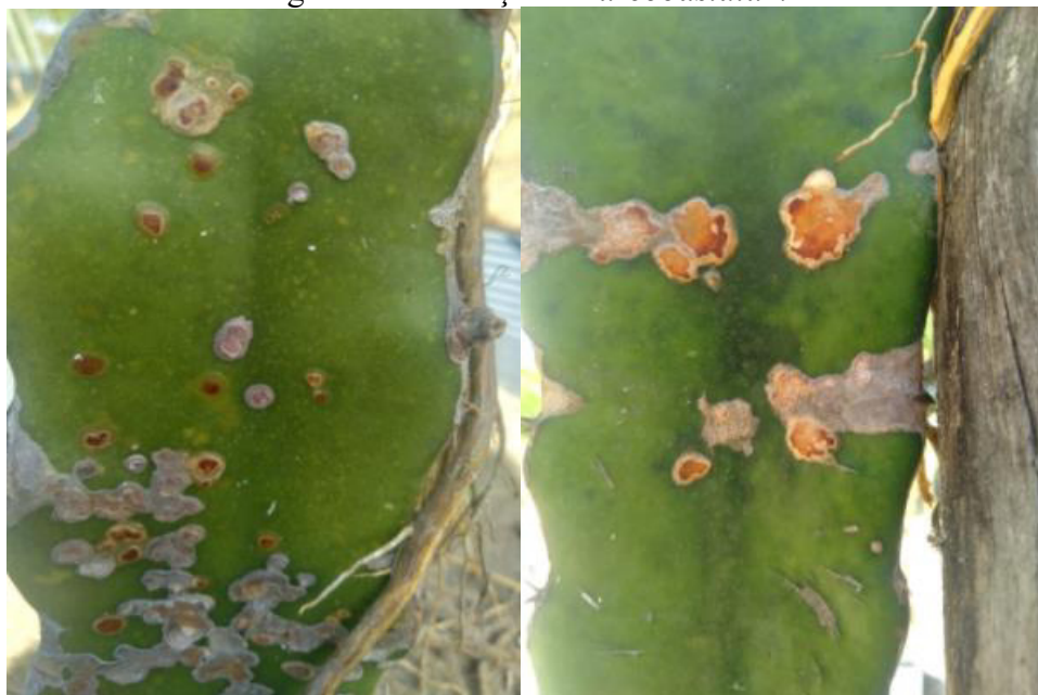
Figura 2 - Presença de Aureobasidium .