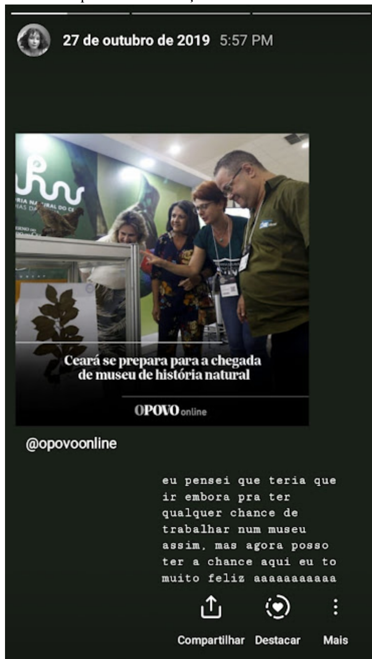
Figura 1 - Momento em que soube da criação do Museu de História Natural do Ceará

imaginava. Menos de um ano depois, em agosto de 2020, recebi por meio do grupo de WhatsApp do PIBID uma mensagem de que o Museu Cearense de História Natural Prof. Dias da Rocha estava selecionando voluntários e receber esta notícia neste período tão difícil de 2020 com a pandemia de COVID-19 foi a chegada de uma esperança e vontade de continuar para viver algo que eu queria muito, que era como um sonho para mim e que eu pensava que só conseguiria mais para frente na minha vida.