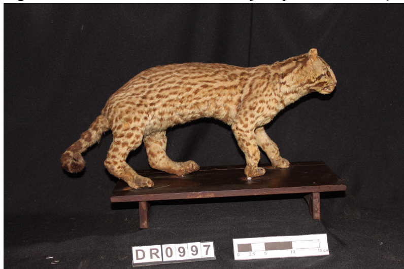
Figura 5 - Taxidermia de Gato maracajá depois da restauração