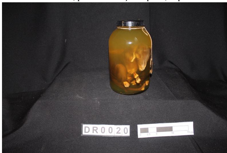
Figura 3 - Bode bicéfalo, parte da coleção líquida, depois da restauração