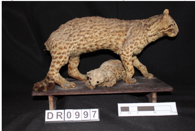
Figura 4 - Taxidermia de Gato maracajá antes da restauração