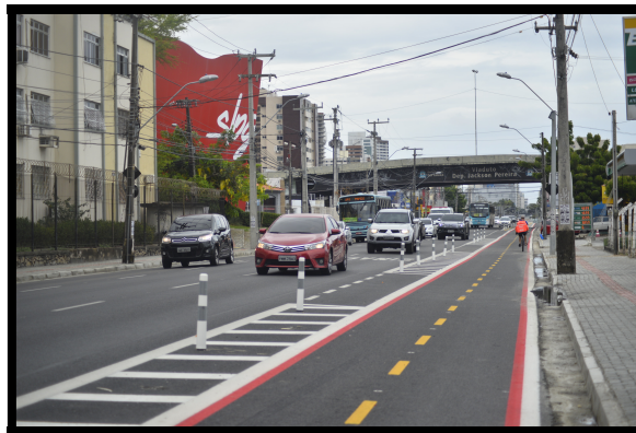
Figura 2 -Binário Av. Santos Dumond e Av. Dom Luís.