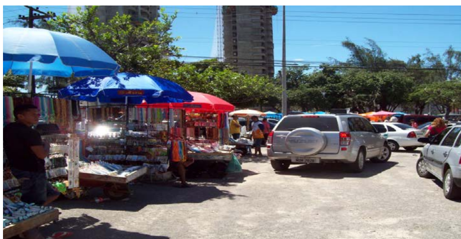
Foto: Apropriações do espaço aos dias 13. Vendedores ambulantes de imagens e objetos sacros a disputar território no estacionamento da igreja.

Por se apropriarem do espaço de forma diferenciada dos planos e perspectivas almejadas pelos urbanistas, os trabalhadores ambulantes subvertem a perspectiva de cidade ordenada, construindo uma paisagem de arranjos e (re) apropriações não convencionais.