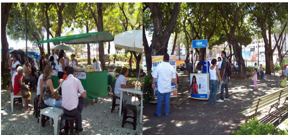
Aos dias 13, panfletistas aproveitam a movimentação da praça para divulgar seus anúncios, e vendedores de comidas típicas demarcam no logradouro um espaço de “praça de alimentação”.

Neste cenário festivo, levadas e mais levadas de gente, a descida e a subida dos ônibus dinamiza a atmosfera da praça, que ao misturar-se a sua paisagem comercial, é capaz de transformar este cenário num verdadeiro caleidoscópio. Em meio a tanta agitação, novos atores, dentre os quais, pedintes, representantes de empresas e panfletistas aquecem mais ainda o ambiente diversificado da praça aos dias 13.