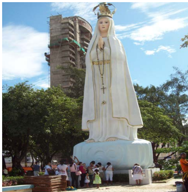
Foto: Imagem de Fátima em meio à profusão de sentidos: entre mutações do capital imobiliário e manifestações de fé.

de 2008. A estátua, medindo 15 metros 84 de altura, passou a compor a paisagem do equipamento, modificando totalmente suas dinâmicas cotidianas. Considerada um ícone para a cultura religiosa da cidade, a imagem demarcou “fisicamente” a presença da Paróquia Nossa Senhora de Fátima no local. Para o poder público, a construção do templo visou aumentar não só o público de fiéis frequentadores da igreja, mas mobilizar fortemente o turismo religioso em Fortaleza.