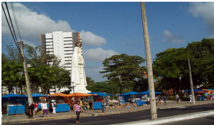
Foto: Visão horizontal da Praça no dia 13 de maio.

Fonte: Vista aérea extraída do Google Maps em 27 de outubro de 2004. A área da Praça está circundada em vermelho.