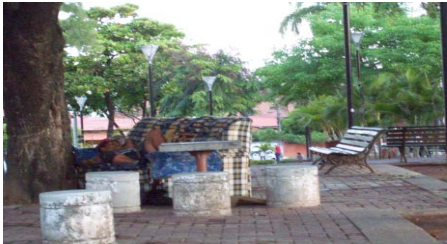
Foto: A praça como casa. Flagra em um de seus “quartos dormitórios”.

Espalhados pelo logradouro, estes utensílios demarcam um tipo específico de uso no território. Ao fazer dela, uma espécie de lar invertido, os moradores de rua imprimem no ambiente, novas funcionalidades, transformando seus segmentos espaciais em quarto, sala, cozinha, banheiro, armário e varal. Como mesmo afirmam os zeladores e permissionários da praça, há dias em que o logradouro mais se parece com “um varal coletivo”, de tanta roupa estendida pelos bancos e jardins.