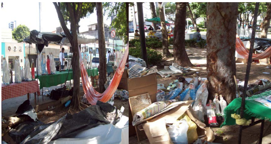
Redes e imagens entre árvores e jardins.

Neste dia de festividade, o anexo do logradouro de Fátima, localizado na Avenida Osvaldo Studart, sai da sua condição de vazio (pois nos dias normais o espaço quase não é utilizado), para se transformar em espaço praticado, apropriado por vendedores a estocar imagens entre árvores e jardins. Muitos deles, cansados da viagem que fizeram de Canindé a Capital, ali mesmo atam suas redes, e espalham colchões para ligeiros e reparadores cochilos.