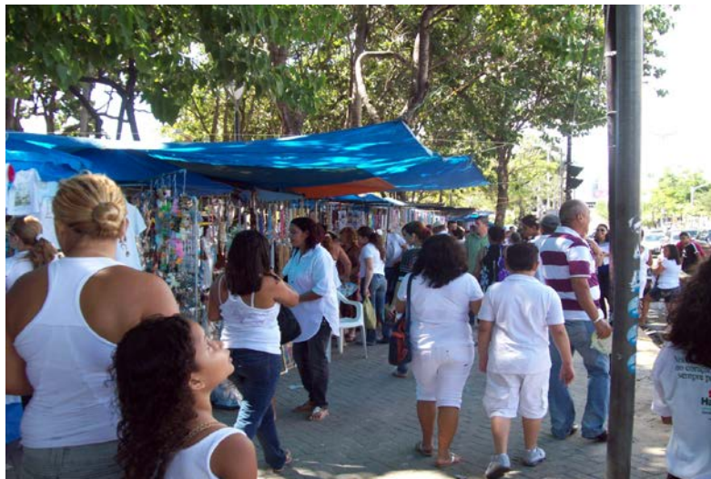
Foto: Calçadão da praça enquanto corredor entre o sagrado da fé e o profano do mercado.

mais fileiras de bancas e camelôs, movimentam um agitado e complexo mercado de objetos sacros, a incluir desde fitinhas de pulso, velas, roupas com mensagens bíblicas, até quadros com paisagens e imagens dos mais variados santos católicos. Neste momento, comércio, negociação e vida sacra convergem para um emaranhado de códigos, sentidos e significados.