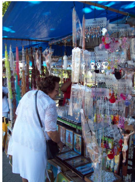
A fé e o mercado ou o mercado da fé. Vendedores de imagens sacras fazem do calçadão da praça um corredor simultâneo de fé e comércio.

O mercado de imagens da Praça de Fátima envolve uma extensa rede de agentes, dentre os quais: fabricantes de imagens provenientes de Canindé; proprietários de comércios existentes no centro de Fortaleza; vendedores autônomos circulantes da Praça (trabalhadores sem ponto fixo no logradouro, que vendem seus produtos circulando pelo ambiente e oferecendo-os diretamente as pessoas); e os vendedores ambulantes, feirantes cadastrados na prefeitura que possuem um ponto fixo (chamados também de permissionários).