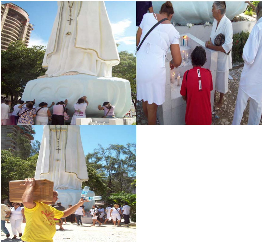
Fotos: A Praça de Fátima entre práticas de devoção e práticas do mercado informal.