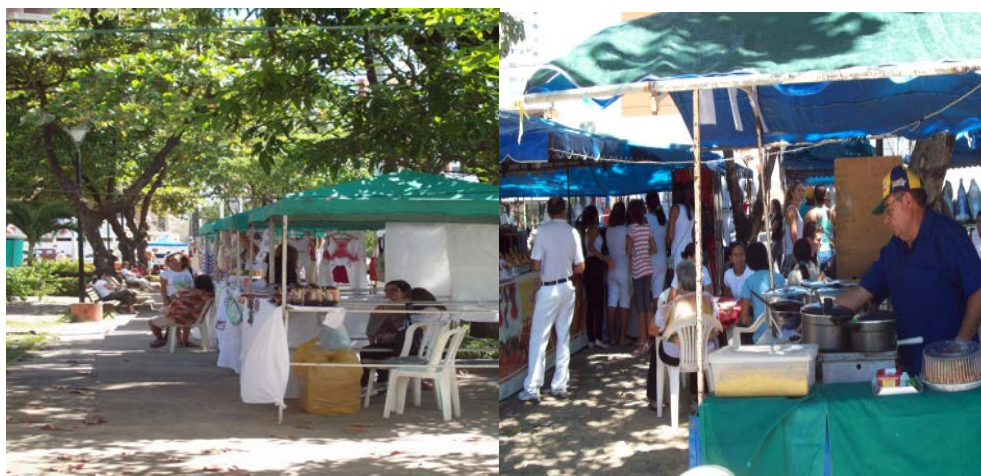
Foto: Aos dias 13 a atmosfera sagrada da Praça de Fátima divide seu espaço com a venda de artesanato e comidas típicas, também agregando aspectos de um território profano.

No dia 13 aqui é muita gente. É festa muito bonita! Tem tudo...(…) Barraca demais! Dia 13 de maio e dia 13 de outubro. Nos outros dias 13 já é menos o movimento, mas nos dias 13 de maio e 13 de outubro, menino, é uma loucura. O povo vive disso meu filho. Todo mundo só vive disso. (Maria, permissionária de barraca que fornece refeições na praça)