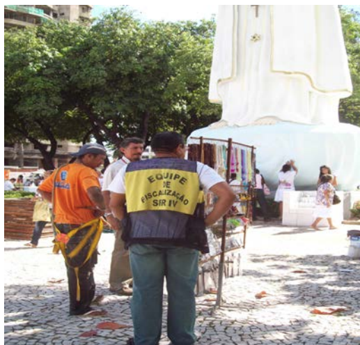
Foto: Aos dias 13 os fiscais da SER IV organizam o espaço. No momento da foto um deles, advertia um vendedor ambulante a circular pela praça.

Reconhecendo o problema do grande quantitativo de feirantes na praça, o supervisor expôs sobre os vendedores volantes, os quais na sua concepção, “não querem ocupar os espaços demarcados pelas autoridades”. Situados nos arredores do logradouro, estabelecem-se no estacionamento da igreja ou nas suas calçadas laterais. Carregando objetos nos braços ou em “pirulitos” (espécie de expositor/mostruário de terços, pulseiras e colares), estes vendedores sem ponto fixo, transformam-se em “contraventores do espaço”, encarados pela prefeitura como coisas “fora do lugar”.