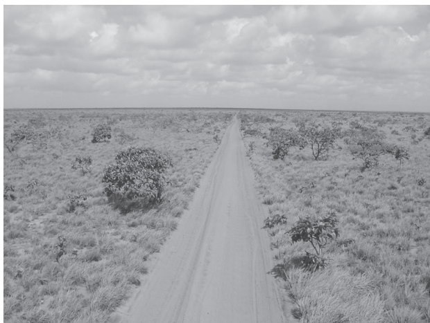
Figura 2. Vista geral da área estudada em Rio do Fogo, Rio Grande do Norte, Brasil.