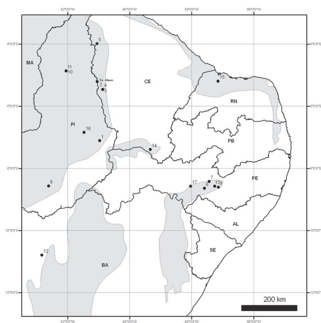
Figura 1. Mapa do Nordeste brasileiro mostrando a localização da Floresta Estacional Decídua Montana da Serra das Almas, Ceará (Sa. Almas) e os levantamentos em área sedimentares (cor cinza) usados na análise de similaridade. Os levantamentos foram os seguintes: 1: Oliveira et al. (1997); 2 a 4: Araújo et al. (1998a); 5: Araújo et al. (1999); 6: Rodal et al. (1999); 7: Figueirêdo et al. (2000); 8: Lemos & Rodal (2002); 9: Andrade et al. (2004); 10 e 11: Farias & Castro (2004); 12: Rocha et al. (2004); 13: Gomes et al. (2006); 14: Costa et al. (2004); 15: Maracajá et al. (2003); 16: M.R.A. Mendes (dados não publicados) e 17: Rodal & Nascimento (2002).

L16. A área com formação florestal foi Rodal & Nascimento (2002): L17.