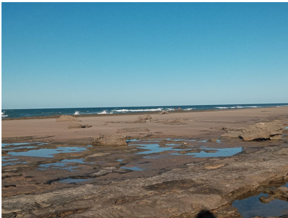
Imagem 3. Visão da região onde será conduzida aula de campo