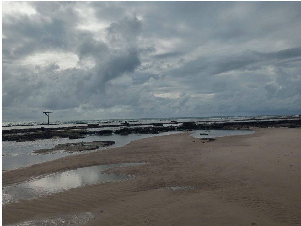
Imagem 2. Visão da região onde será conduzida a aula de campo