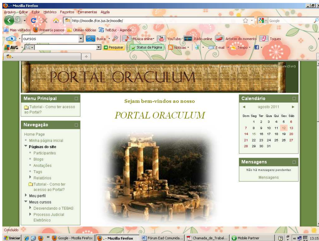
Imagem 2 – Portal Oraculum – layout atual ( http://moodle.jfce.jus.br/moodle/ )