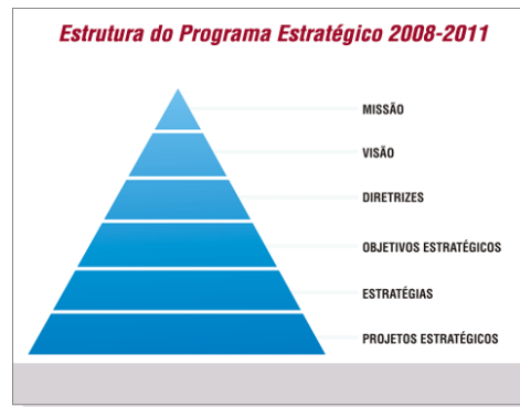
Figura 1 – Estrutura do Programa Estratégico do Banco do Nordeste 2008-2011

O Programa Estratégico 2008-2011 (BANCO DO NORDESTE, 2011d) foi elaborado com a seguinte estrutura: