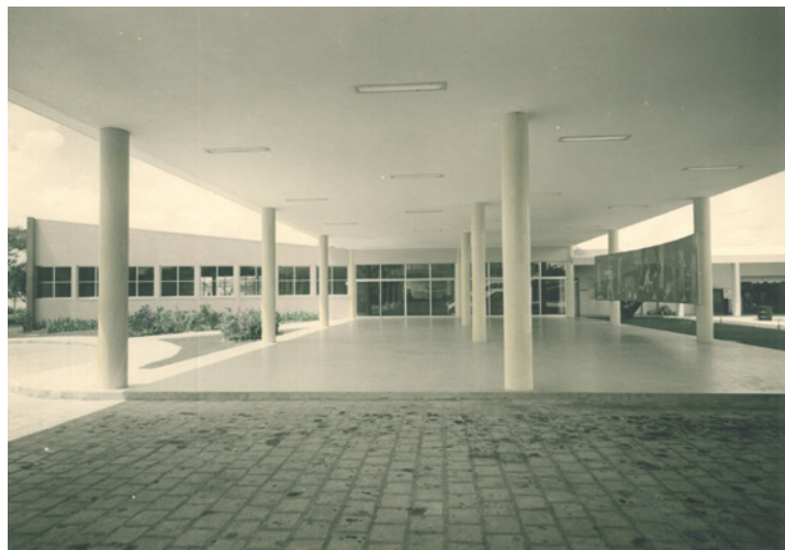
Figura 4 - Departamento Autônomo de Estradas e Rodagem (DAER, 1962) - Atual Procuradoria Geral de Justiça do Estado do Ceará