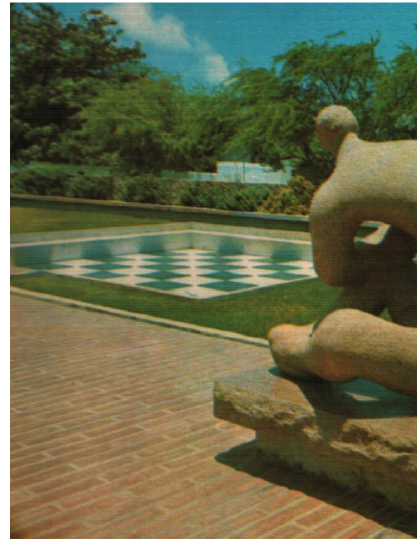
Figura 9 – Escultura “Montanha” de Bruno Giorgi e vitral de Marianne Peretti