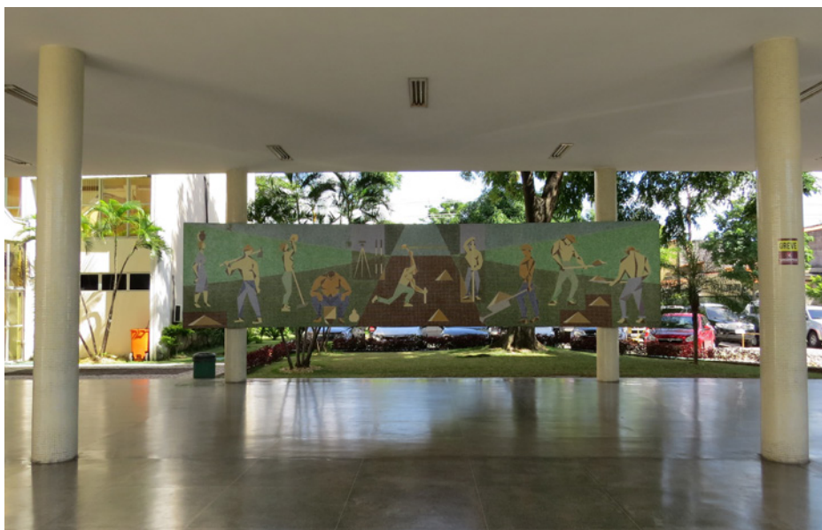
Figura 5 - Mural Artístico "Trabalhando no Campo" - Zenon Barreto (DAER (1962)

"Trabalhando no campo" permanece em muito bom estado no acesso ao prédio, mesmo depois de várias alterações e reformas na edificação, como a colocação de um gradil e a implantação de estacionamentos, que subtraíram de alguma forma a visibilidade pública da obra.