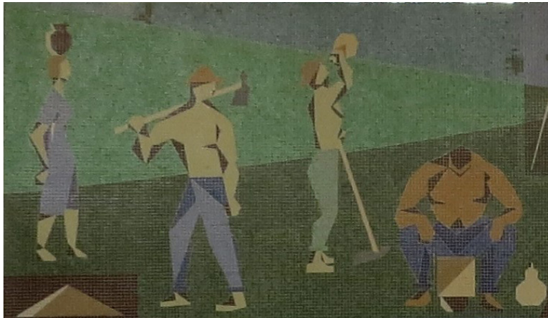
Figura 6 – Detalhe Mural Artístico "Trabalhando no Campo" - Zenon Barreto (DAER (1962)