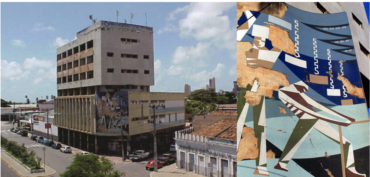
Figura 2 - Mural “Os Estivadores” Centro de Exportadores do Ceará (1962) – Fim da década de 1990 em estado de degradação

O edifício ficou desocupado por muitos anos, o que resultou em grande prejuízo, decadência e deterioração do conjunto, inclusive do painel, que ficou praticamente destruído (Figura 2), assim permanecendo até o início dos anos 2000, quando foi adquirido pela Secretaria da Fazenda do Governo do Estado do Ceará (SEFAZ-CE). Devido à necessidade de ampliação das suas instalações, foi feita a licitação do projeto de reabilitação, no ano de 2005.