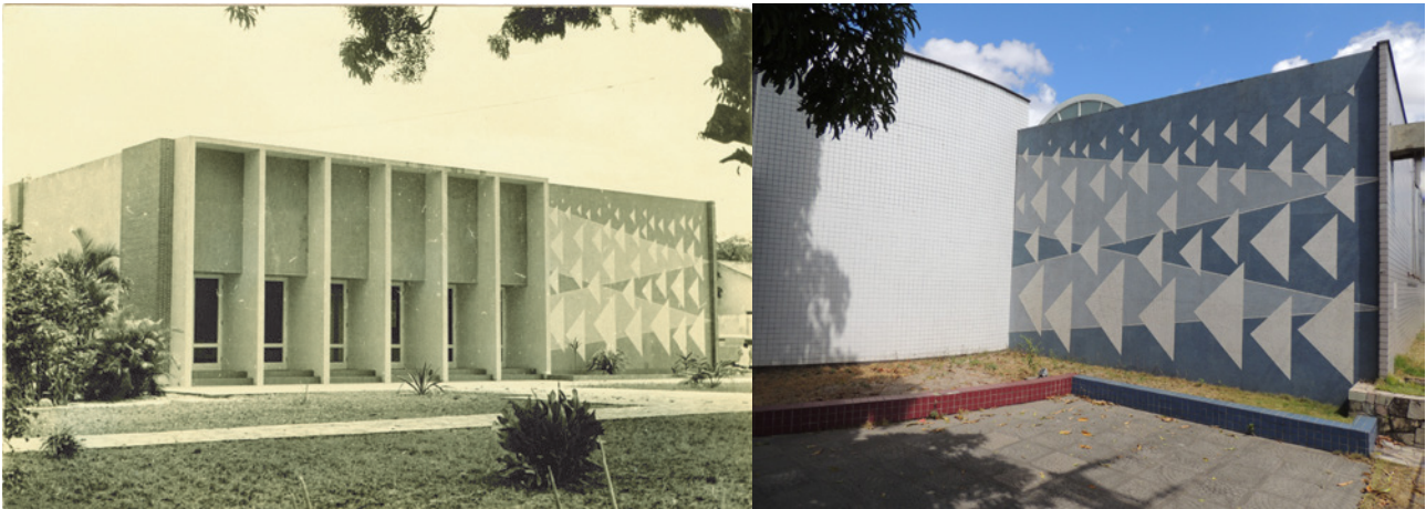
Figura 1 - Mural “Jangadas” Museu de Arte de Fortaleza (década de 1960) e atualmente

de 1997, quando já era sede do Banco do Ceará (BANCESA), se enquadrou neste contexto de mudanças dos atributos de centralidade do centro de Fortaleza e das novas dinâmicas urbanas e metropolitanas (PAIVA; DIÓGENES, 2012).