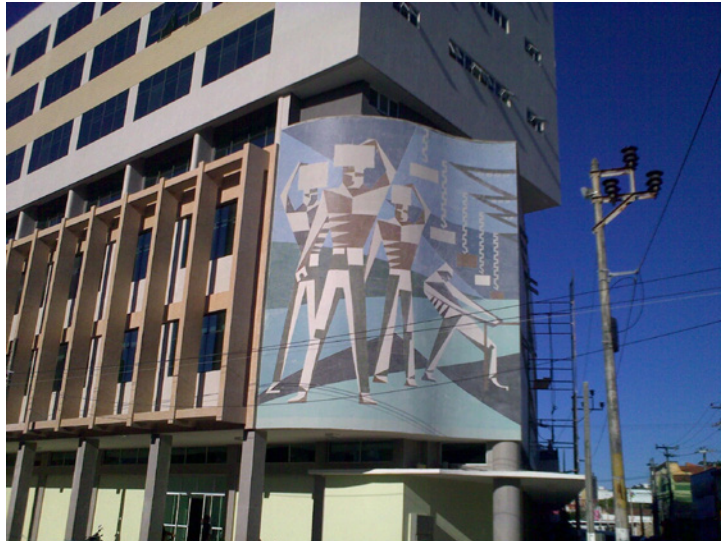
Figura 3 - Mural “Os Estivadores” Centro de Exportadores do Ceará (1962) – Fotos atuais pós retrofit

A inserção urbana do edifício rehabilitado possibilitou o dinamismo da área, com o restabelecimento do uso, potencializado pela presença de outros edifícios da SEFAZ nas proximidades, suscitando novos fluxos. Trata-se também de um exemplo da necessidade de estimular o retorno de sedes de instituições públicas para o Centro que, em um “efeito cascata”, estimula o surgimento de espaços terciários privados (comércio e serviços). Colaborou para a reabilitação do edifício a restauração do mural artístico (Figura 3), elaborada de maneira cuidadosa, em obediência ao desenho original (7) . A recuperação da obra (8) de Zenon Barreto restabelece a memória do artista e evidencia o caráter público da arte urbana, servindo de modelo para novas intervenções em edifícios modernos e históricos em geral.