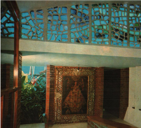
Figura 8 - Vitral de Marianne Peretti