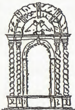
1700-N.S. DO ROSÁRIO-EMBU