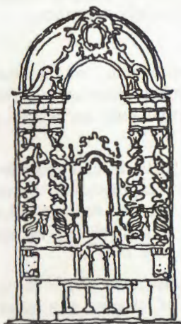
1700-N.S. DO CARMO-RECIFE