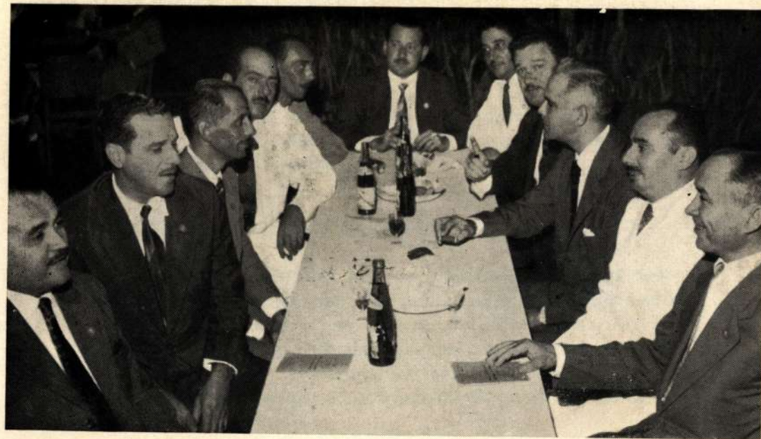
Flagrante da homenagem prestada pela Reitoria aos participantes da 10ª Jornada de Pediatria

Por ocasião de sua viagem a Recife, onde foram participar do Festival de Teatro, estiveram em visita ao Reitor Martins Fi-