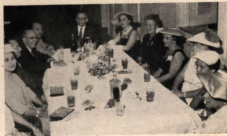
Outro aspecto da homenagem que a Reitoria prestou aos participantes da 10ª Jornada de Pediatria