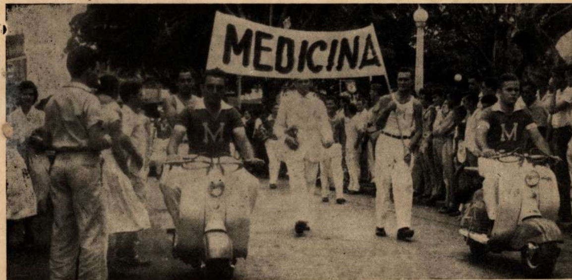
Desfile de abertura dos II jogos universitários do Ceará promovidos pelo Diretório Central dos Estudantes