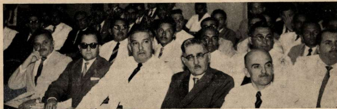
Outro aspecto da assistência presente às aulas do curso.

Tôdas as quintas-feiras, o Centro de Estudos dos Assistentes da Faculdade de Farmácia e Odontologia da Universidade do