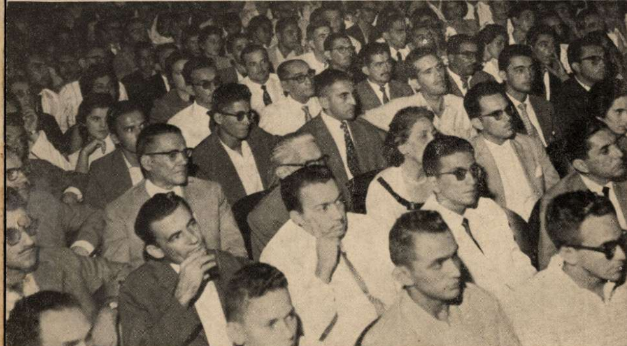
Aspecto da numerosa assistência que participou dos debates sôbre o divórcio, na Faculdade de Direito da Universidade do Ceará.