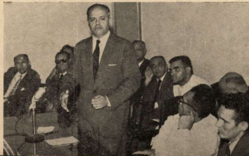
A convite da Escola de Debates do Centro Acadêmico Clóvis Beviláqua, da Faculdade de Direito, o Deputado Nelson Carneiro versou sobre a "Instituição do Divórcio no Brasil".