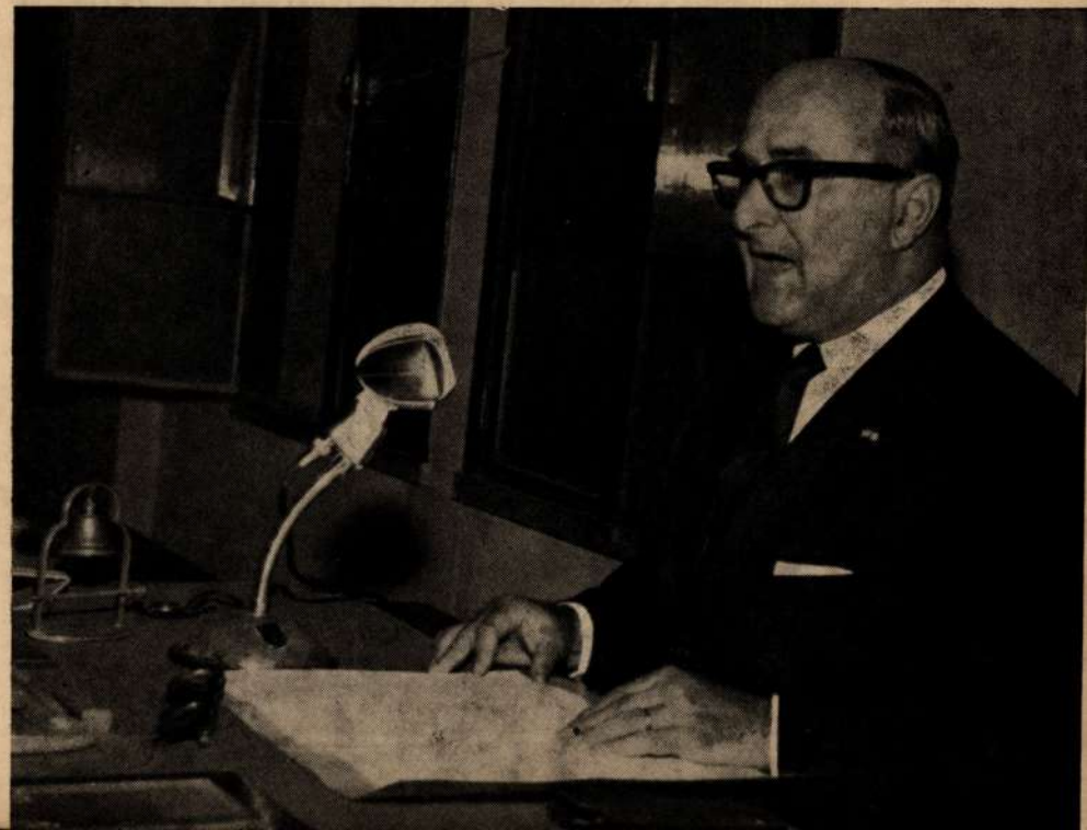
Flagrante da conferência pronunciada pelo General Macedo Soares no Curso sôbre Problemas de Desenvolvimento Econômico

Sob o patrocínio da Associação Franco-Brasileira, realizou-se, no dia 15 de outubro, no Conservatório de Música Alberto Nepomuceno, a abertura de uma Exposição Fotográfica Sôbre “Mozart