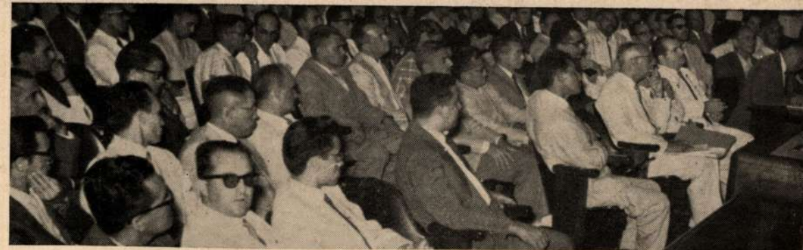
Professôres, Técnicos e estudiosos de assuntos econômicos assistem a uma aula sobre problemas de desenvolvimento econômico