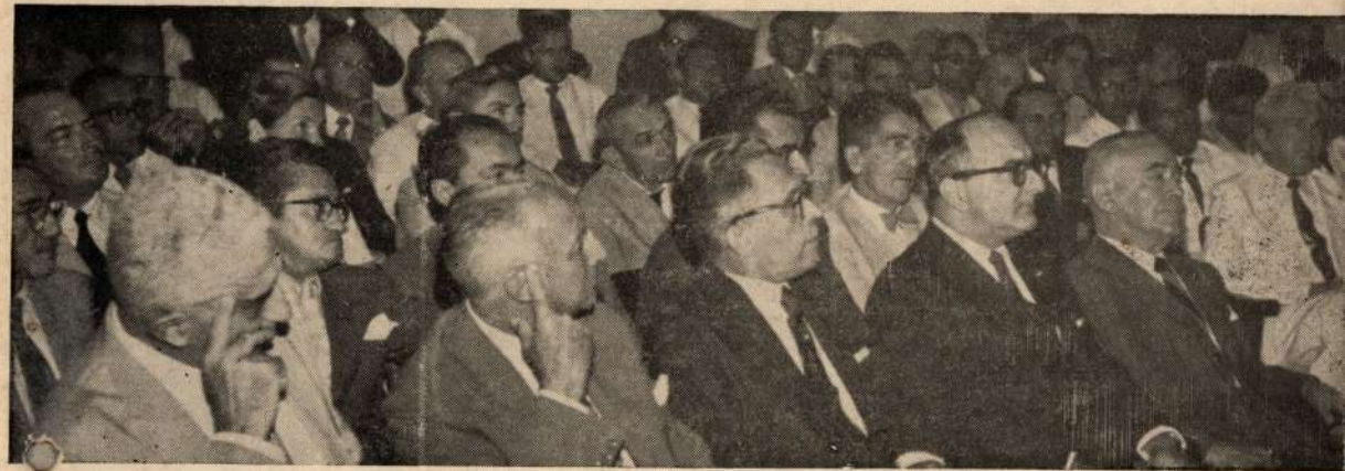
Aspecto parcial da assistência presente à conferência do Presidente da Siderúrgica Nacional