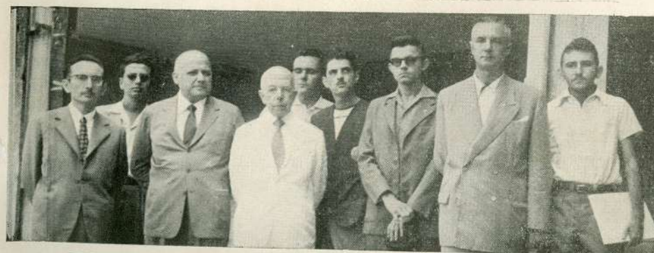
Alunos da Escola de Engenharia do Ceará visitando a Universidade de Minas Gerais.