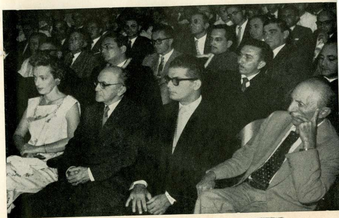
Aspecto parcial da assistência que compareceu à Assembléia Universitária assinalativa do início dos Cursos