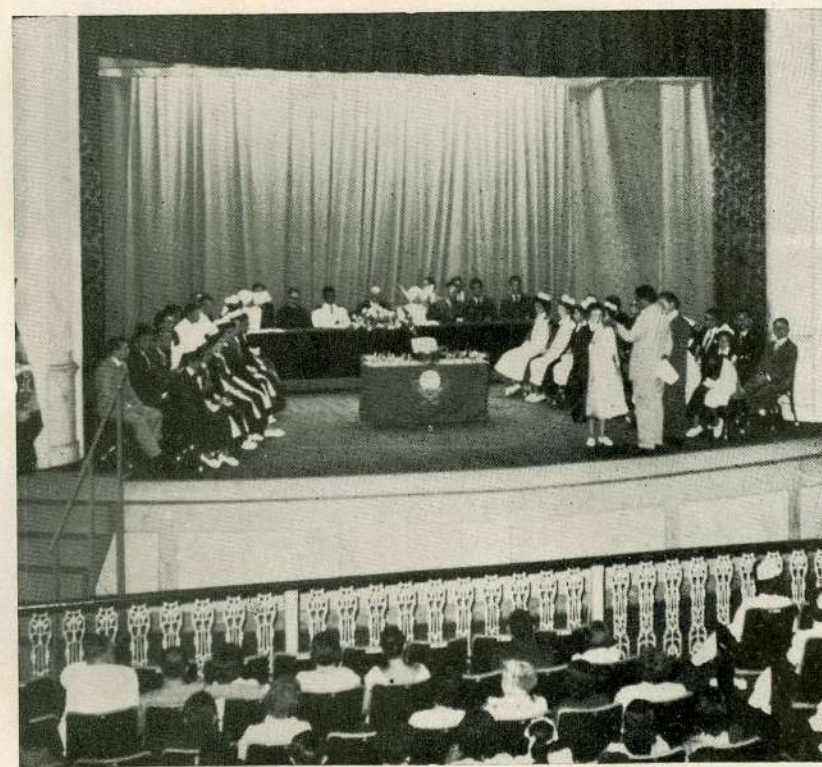
Flagrante da solenidade de formatura de nova turma da Escola de Enfermagem S. Vicente de Paulo, da Universidade do Ceará, realizada no Teatro José de Alencar.