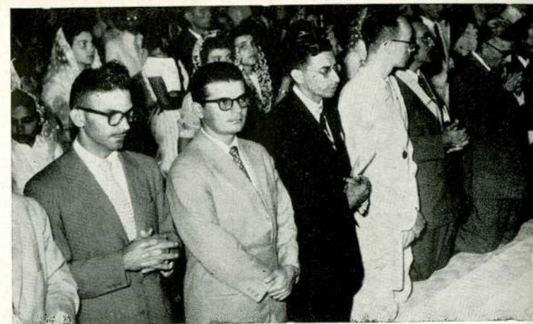
Professôres participam da Páscoa dos Universitários.