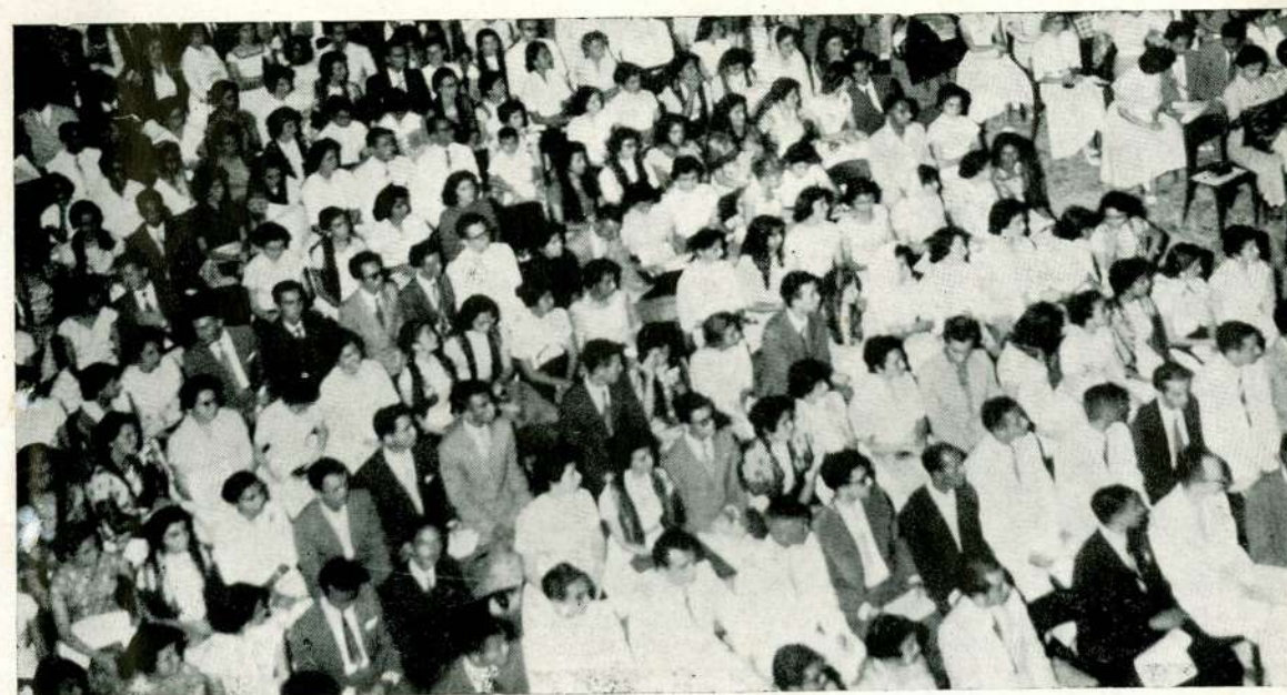
Alunos de tôdas as Faculdades fizeram sua festa de Páscoa nos jardins da Reitoria.