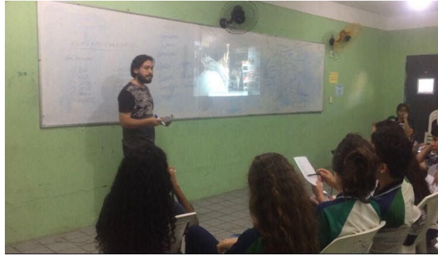
Figura 1. Clase 5 del curso de español para principiantes.