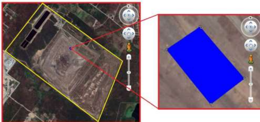
Figura 1. Limites do Aterro Sanitário de Caucaia (em amarelo) e localização da área pesquisada (em azul)

A área pesquisada tem 929m 2 e 125m de perímetro. Foi composta por 02 bermas e 01 talude. Seus limites são apresentados na Tabela 1.