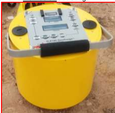
Figura 3. Vista do equipamento Humboldt GeoGauge™ sobre o solo do aterro sanitário

O Humboldt GeoGauge™ aplica uma força dinâmica, muito reduzida, com frequências variáveis (com incrementos de 4 Hz) entre 100 e 196 Hz (ALSHIBLI et al. 2005). Durante o ensaio, a força aplicada ( F ) e o respectivo deslocamento ( \delta ) são medidos para 25 diferentes frequências de vibração. A força máxima produzida pelo Humboldt GeoGauge™ corresponde a 9N e os deslocamentos induzidos no solo não ultrapassam 1,27 \times 10^{-6} m (ALSHIBLI et al. 2005).