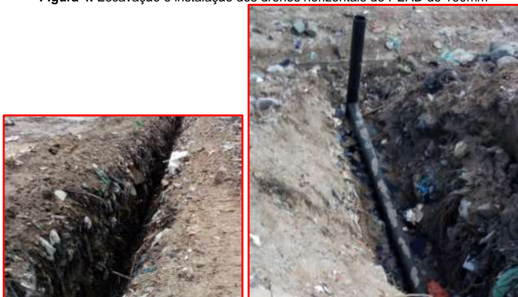
Figura 4. Escavação e instalação dos drenos horizontais de PEAD de 160mm

Na berma inferior e no talude, a rigidez foi menor no “ponto central” (PBI 2 e PT 2) indicando a ausência de cuidados no fechamento das escavações realizadas pelo operacional do aterro sanitário quando da instalação de drenos horizontais de captação forçada de gás (na realidade, observou-se que para evitar danos aos tubos de PEAD, Figura 4, pouca ou nenhuma compactação tem sido realizada sobre esse local). Conforme Fredlund e Rahardjo (1993) a presença, em solos, de uma pressão negativa nos poros (sucção) é um dos principais fatores de alteração do comportamento geomecânico.