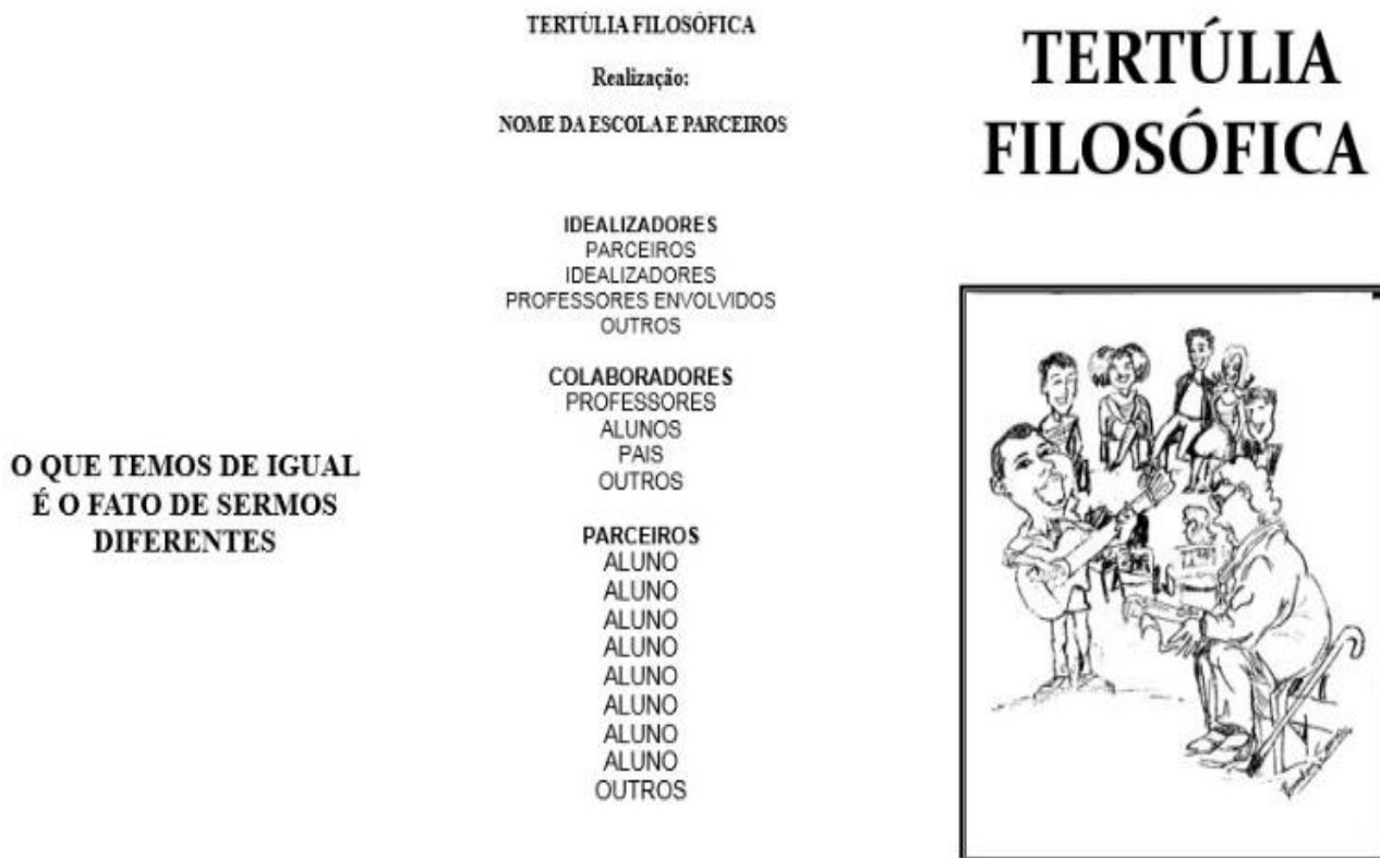
Figura 2 - Protótipo do Folder da Tertúlia Filosófica sobre gênero (frente)