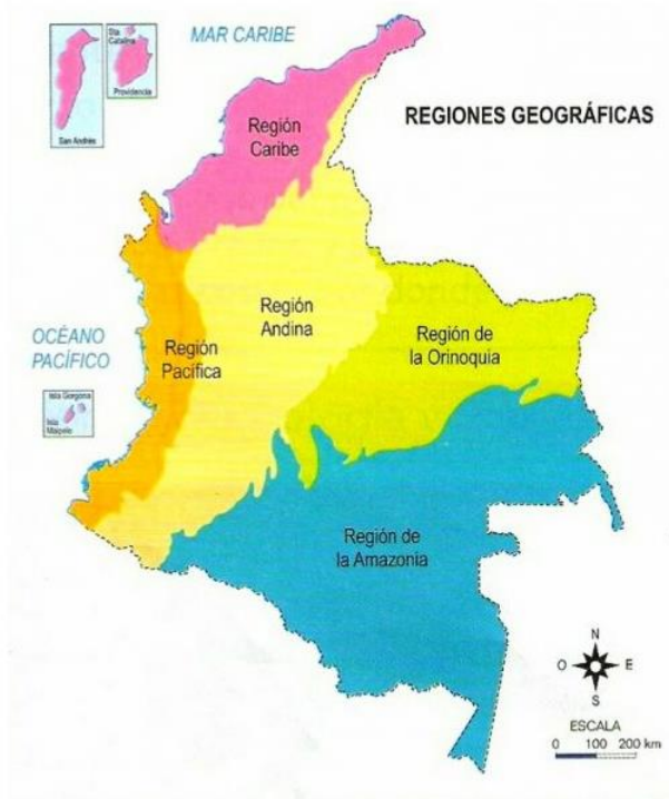
Figura 2. Regiões Naturais da Colômbia.

O PACIFICO COLOMBIANO, DE REGIÃO A PAISAGEM: UMA LEITURA DESDE O SIMBÓLICO E CULTURAL para os mercados mundiais (ESCOBAR, 2004). De maneira que o Pacífico se converteu em ponto estratégico para a exploração de recursos naturais, especificamente de madeira, de camarões, de minerais como ouro, e de plantação extensiva; e ao mesmo tempo é a zona de plantações e produção de psicotrópicos, de tráfico de armas, entre outros, configurando-a num lugar de conflitos, onde confluem e se sobrepõem os interesses do capital, dos ex-guerrilheiros-BACRIM, dos narcotraficantes e das comunidades negras que se resistem a deixar suas terras, terras que tem sido concedida pelo Estado através da Lei 70 de 1993.