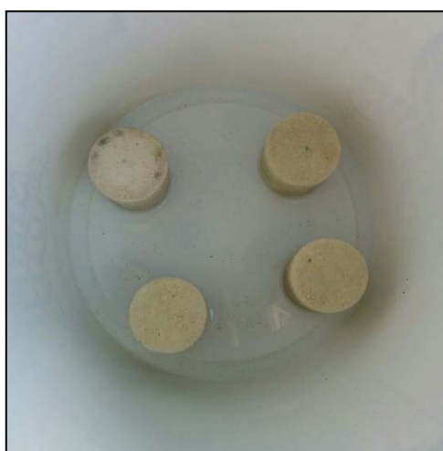
Figura 4: Filtro internamente com velas