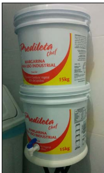
Figura 3: Filtro artesanal utilizado na pesquisa

A água bruta ou já tratada com cloro era filtrada e analisada em laboratório.