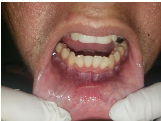
Figura 5. Incisão cirúrgica 2 meses após a cirurgia.

A paciente retornou para consulta ambulatorial com 2 semanas relatando ainda dor em mandíbula com melhora parcial ao uso de analgésicos e hipoestesia em mento. No retorno ambulatorial de 1 mês relatou melhora dos sintomas e no retorno ambulatorial de 2 meses relatou leve parestesia de lábio inferior e região mentoniana. Histopatológico evidenciou adenoma folicular. Laringoscopia foi realizada no primeiro retorno ambulatorial com 14 dias e apresentava características normais. Relata ter ficado satisfeita com resultado estético (Figura 5).