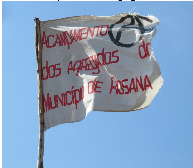
Figura 3- Bandeira do Acampamento dos Agregados do Município de Rosana

Reafirmando o trecho citado anteriormente de Sigaud (2000) com as concepções de Machado (2007), foi possível observar durante a visita ao Acampamento dos Agregados a materialização da estratégia política que são os acampamentos, por meio de uma bandeira (Figura 3) hasteada ao centro do acampamento com um suporte de mais de quatro metros de altura.