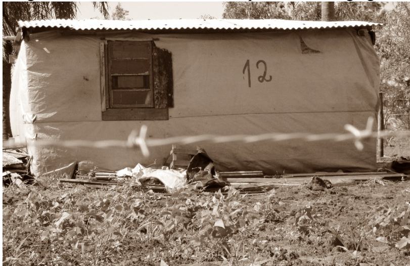
Figura 2- Barraco de Lona no Acampamento dos Agregados