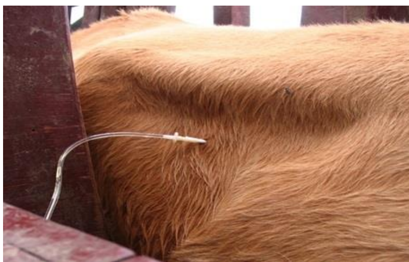
Figura 1 – Ponto de aplicação na fossa paralombar direita (Arquivo pessoal: Blanco A.L., 2018).

Assim, não há invasão da zona de fuga do animal, evitando-se reações abruptas e violentas, com menos estresse durante o procedimento.