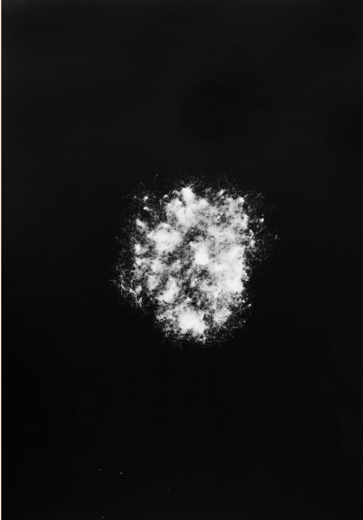
Demorar [A materialidade da imagem e os processos artísticos ontemporâneos] - Renata Voss Chagas