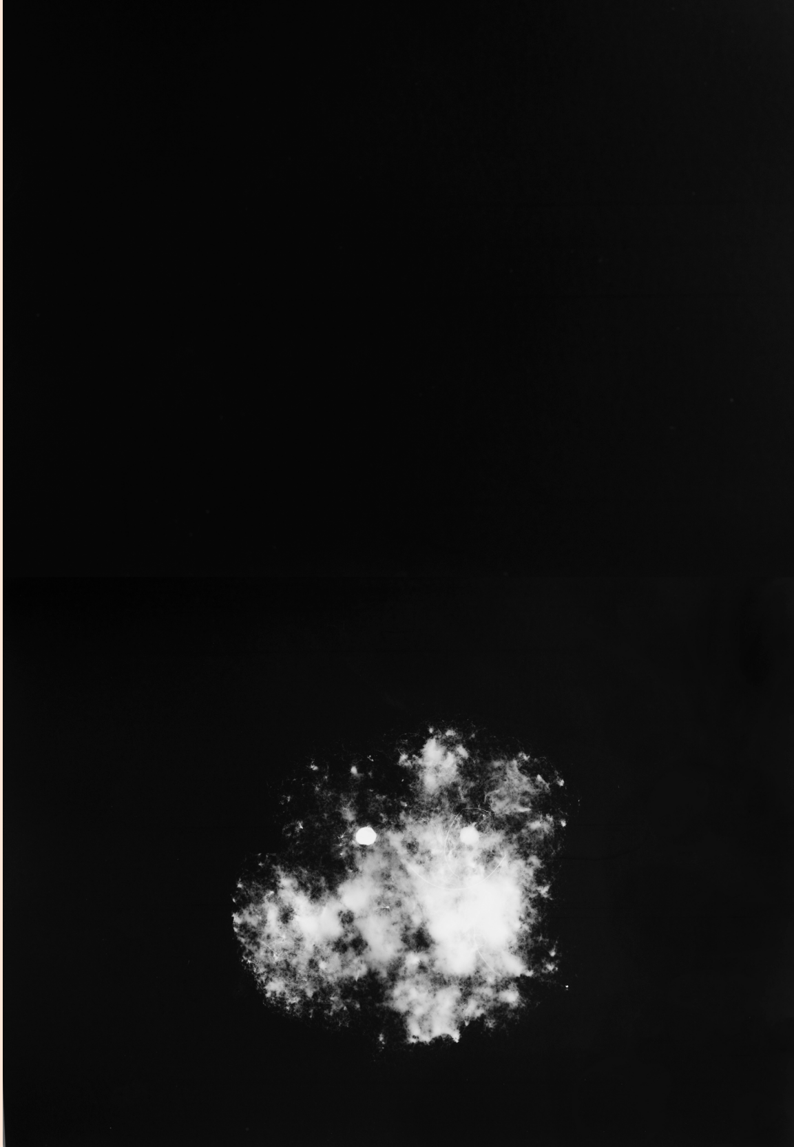
Demorar [A materialidade da imagem e os processos artísticos ontemporâneos] - Renata Voss Chagas