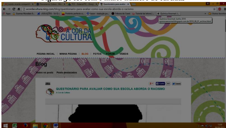
Figura 3 Post com o maior número de curtidas 8