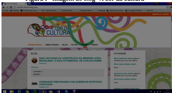
Figura 1 - Imagem do blog “A Cor da Cultura” 4

O blog analisado foi criado a partir do projeto “A Cor da Cultura”, que valoriza o patrimônio cultural afro-brasileiro e reconhece a história e a contribuição da população negra à sociedade brasileira. Desde seu início, em agosto de 2006, o projeto exhibe séries audiovisuais e apresenta recursos didáticos complementares à formação de educadores. Quando criado o blog, o projeto enfrentou diversos desafios, como a produção de conteúdo, a ampliação das redes de parcerias para articulação e a manutenção de abordagem de forma diferenciada, para dar o enfoque sobre as temáticas da população negra.