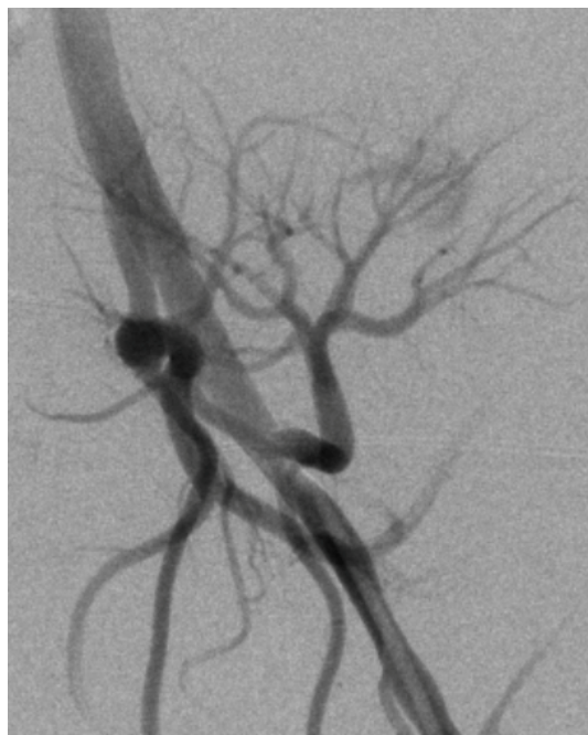
Figura 3. Angiografia com cateterização seletiva de pseudoaneurisma.