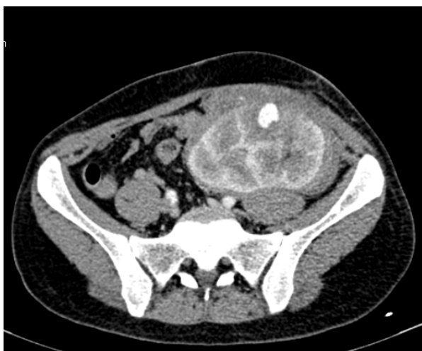
Figura 1. Tomografia computadorizada evidenciando extravasamento de contraste intrarrenal.

Após o diagnóstico tomográfico, foi optado por tratamento endovascular de pseudoaneurisma em enxerto renal. Foi realizada a punção da artéria femoral esquerda, seguido de aposição de introdutor 5 french (fr) e angiografia sob subtração digital. Evidenciado pseudoaneurisma intrarrenal com fluxo, proveniente de ramo arterial terciário (Figura 2). Com o auxílio de um guia 0,014 polegadas e micro cateter 2,6 Fr foi cateterizado o ramo nutridor do pseudoaneurisma, obtendo-se melhor definição da lesão (Figura 3).