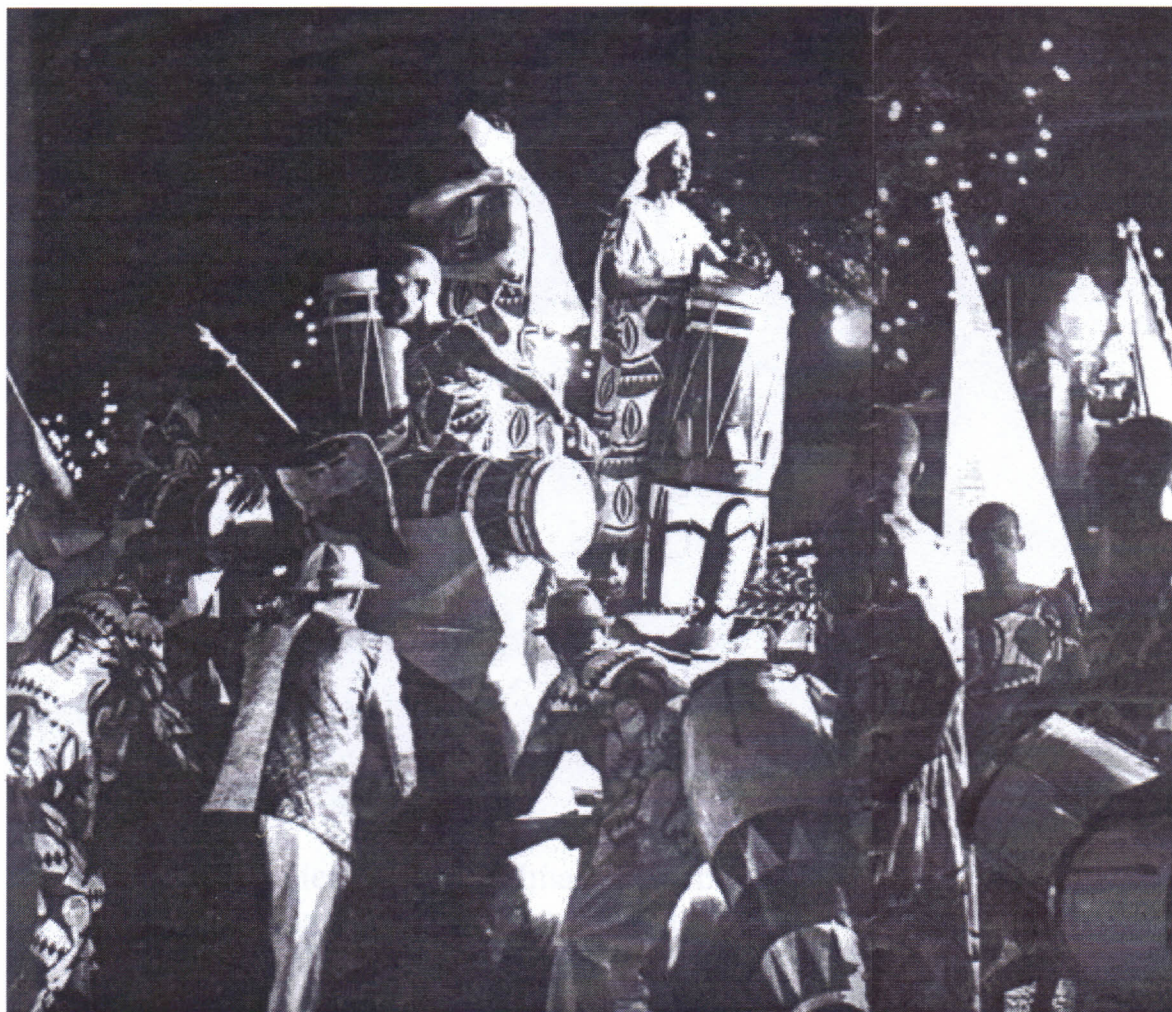
Salgueiro 1960 – Detalhe dos atabaques, adereços do abre-alas do enredo Zumbi dos Palamares , ocasião em que a escola inaugurou uma abordagem do negro como herói.