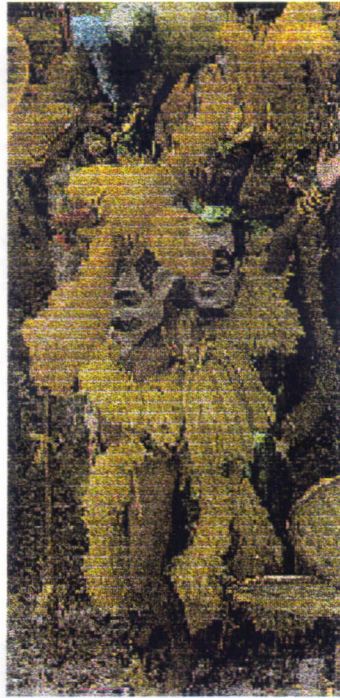
Lixo da Política: Vedetes envovildas em boás, com máscaras de personagens políticos da época.