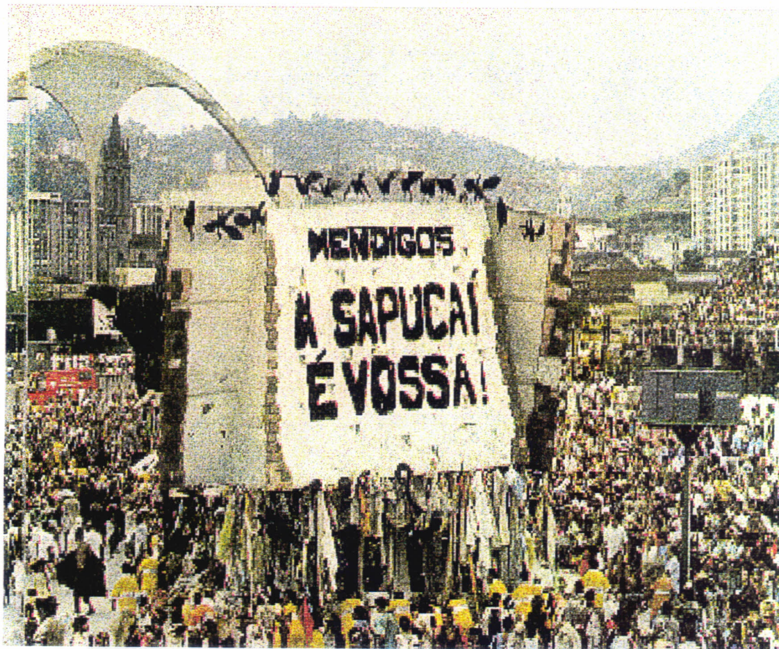
Detalhe da parte de trás do carro Convite : Delimitação do espaço simbólico. Os mendigos tomam posse da avenida.