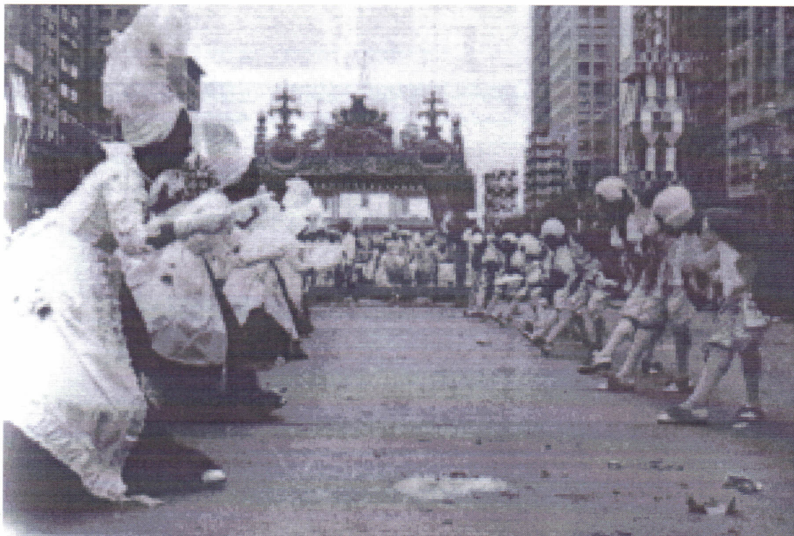
Salgueiro 1963 (Xica da Silva): Imagens da polêmica coreografia do minueto. Cuidado na concepção e acabamento das fantasias e alegorias, e acusações de deturpação das raízes das escolas de samba.