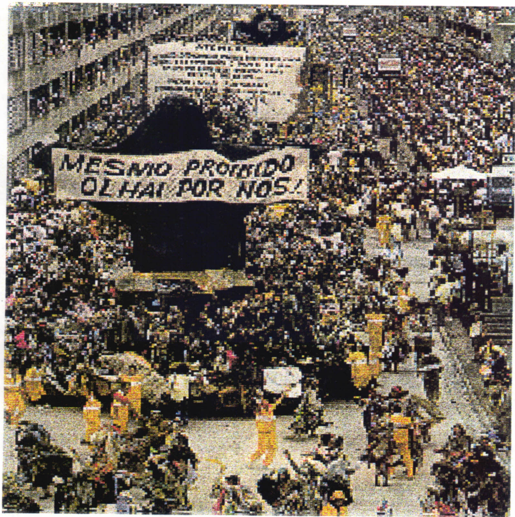
Visão frontal da escola: impacto do público diante da apresentação dos mendigos. A faixa sobre o Cristo soa como um desafio.