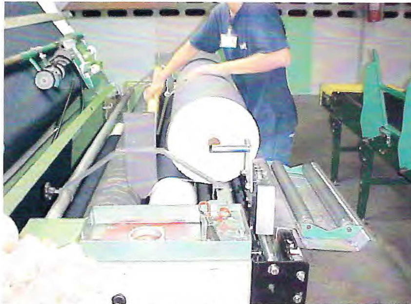
Figura 2 - Funcionário concluindo o processo de inspeção

A consideração de todos estes diferentes fatores na atribuição ou estudo de um determinado posto de trabalho tem especial relevância, não só do ponto de vista humano, mas também do ponto de vista econômico. Apesar de tudo isto se verifica que o aumento da produtividade não é o principal objetivo da ergonomia, mas sim um dos seus efeitos. As técnicas utilizadas pela ergonomia na análise do trabalho podem dividir-se em diretas e indiretas: