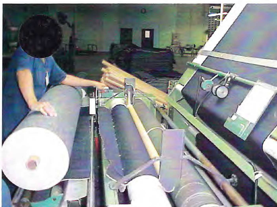
Figura 3 - Funcionário retirando o rolo de tecido

Foram analisados e considerados em cada posto de trabalho, como especificado na Figura – 3 a seguir, todos os requisitos da décima sétima Norma Regulamentadora do trabalho urbano (NR – 17 – Ergonomia), as condições de conforto como ruído e conforto térmico foram avaliadas com base nos itens 17.5.2 a, b, c e d da NR-17. As condições de iluminação foram avaliadas com base no item 17.5.3 e subitens, da NR-17.